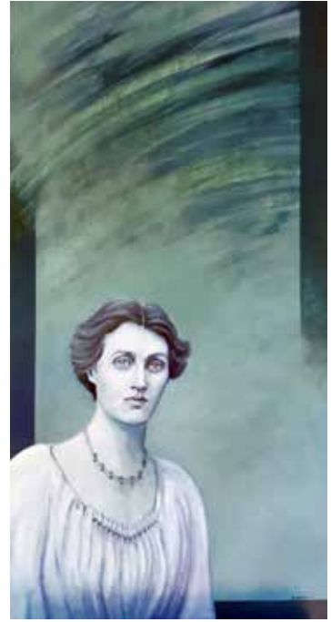
Londres, 1879 - Chaleston, 1961

Una de les introductores de l'Impressionisme a Anglaterra, germana gran de Virginia Wolf, i membre destacat del grup de Bloomsbury.