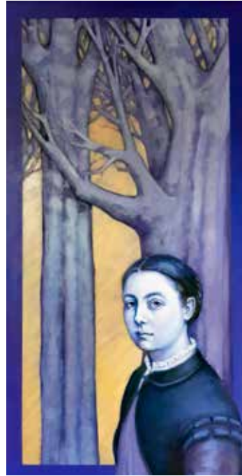
Cremona, 1532 - Palerm, 1625

Considerada la millor dona artista del seu temps, Sofonisba Anguissola fou la primera pintora professional o d'èxit del Renaixement. Tot i haver estudiat amb pintors professionals, no va tenir mai la possibilitat de dibuixar el cos humà del natural, ni d'estudiar anatomia, ja que en aquells moments es tenia per impropï d'una dona.