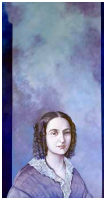
FANNY HENSEL MENDELSSOHN