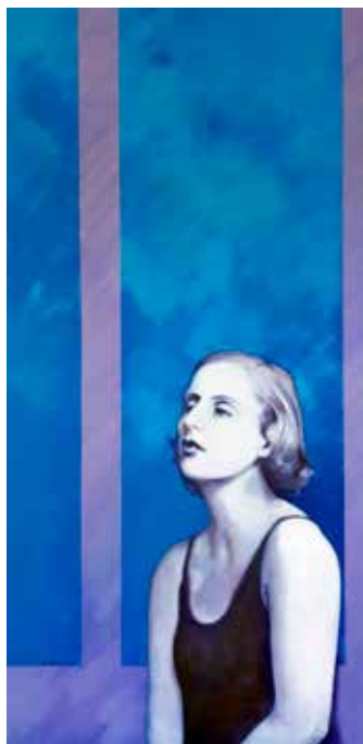
TAMARA DE LEMPICKA

Varsòvia, 1898 - Cuernavaca, Mèxic, 1980