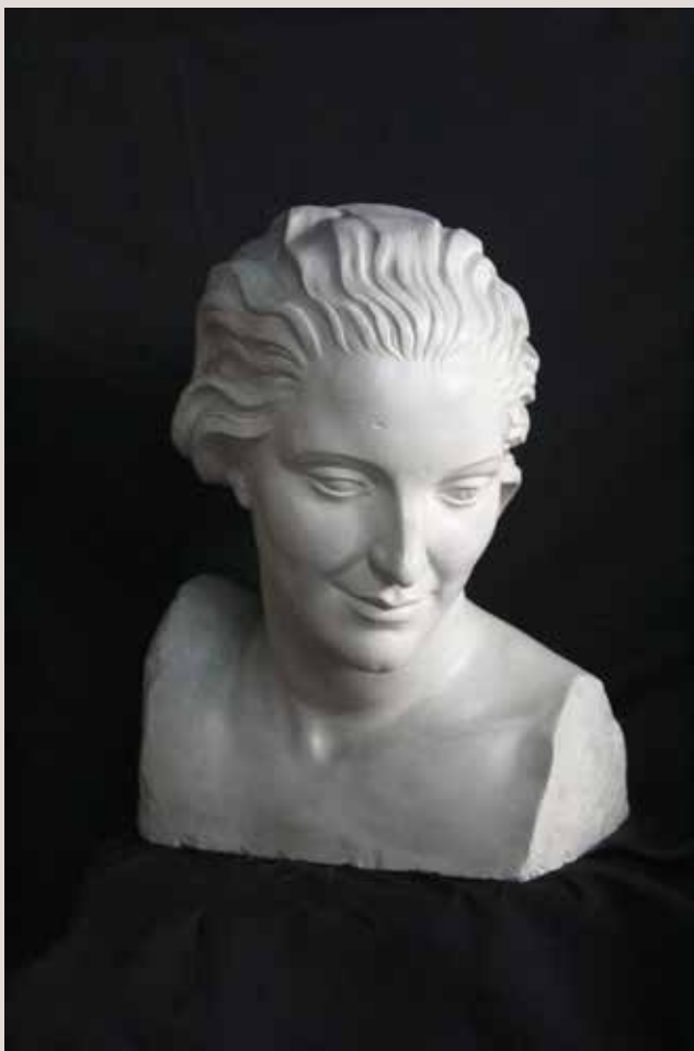
LLIBERTAT n° 2. Guix patinat, 45x34x35. Col·lecció Pérez-Peresejo (Madrid).