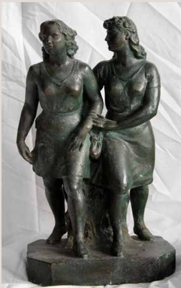
LES DOS GERMANES. Argila cuita patinada, 42x24x17,5. Col·lecció Pérez-Peresejo (Madrid).