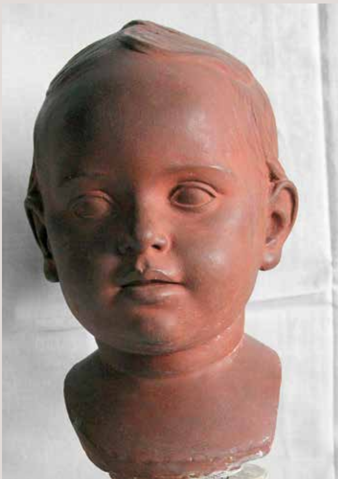
NENA. Guix patinat, 25x15x21. Col·lecció Pérez-Peresejo (Madrid).