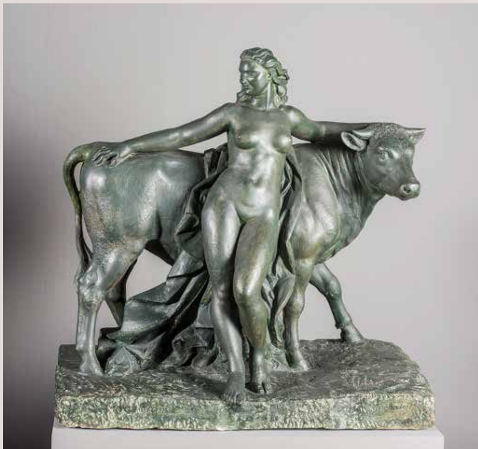
EL RAPTE D'EUROPA, 1943. Guix patinat, 78x79x48. Col·lecció Pérez-Peresejo (Madrid).