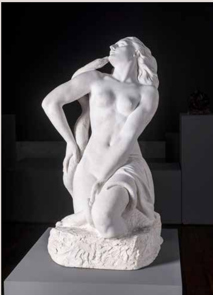
SALAMBÓ, 1936. Guix, 73x37x39. Col·lecció Ajuntament d'Alcoi.