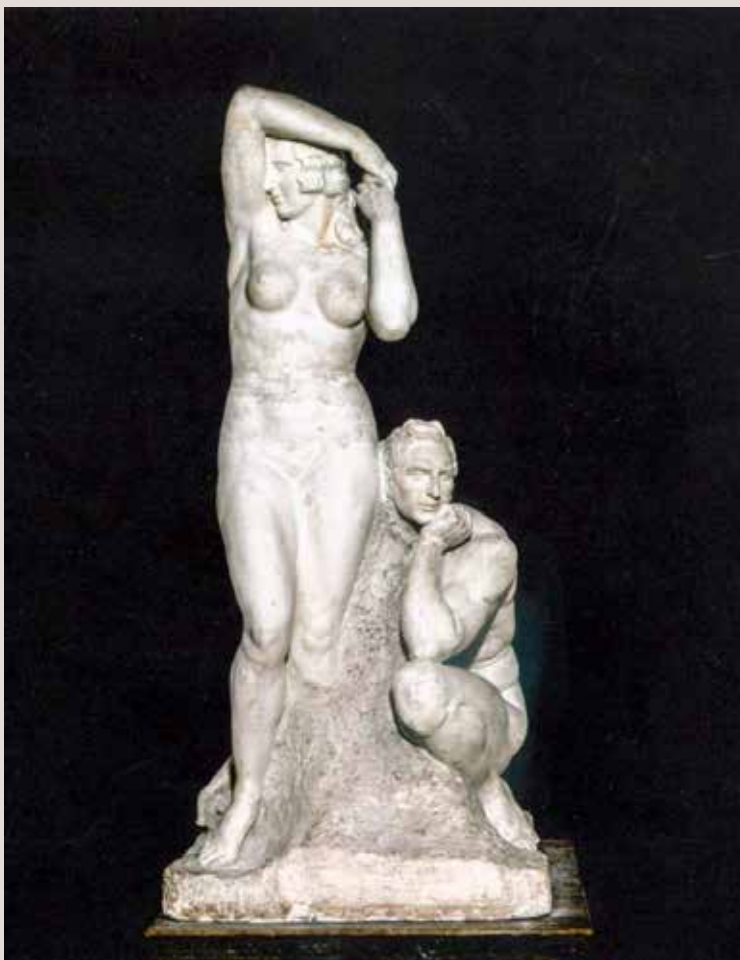
LA MUSA DE L'ARTISTA, 1930. Guix, 232x106x92. Col·lecció Ajuntament d'Alcoi.