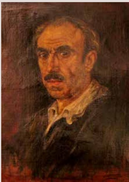
AUTORRETRAT I, 1960. Grafit/paper. Col·lecció Pérez-Peresejo (Madrid).