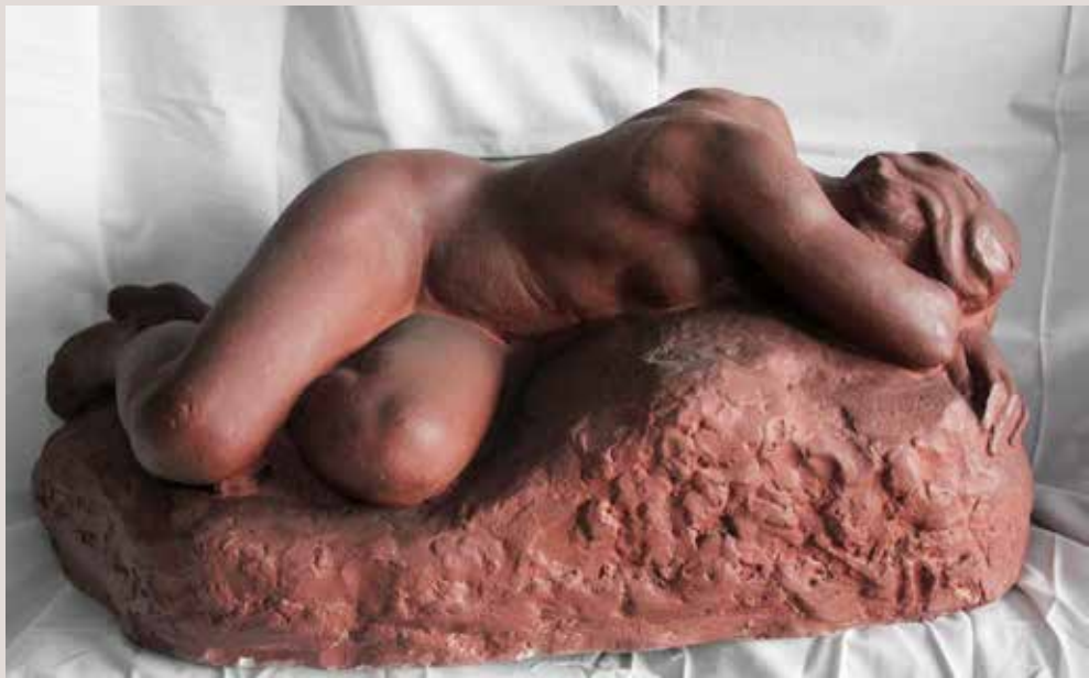
PENEDIMENT, 1943. Guix patinat, 32x66x36. Col·lecció Pérez-Peresejo (Madrid).