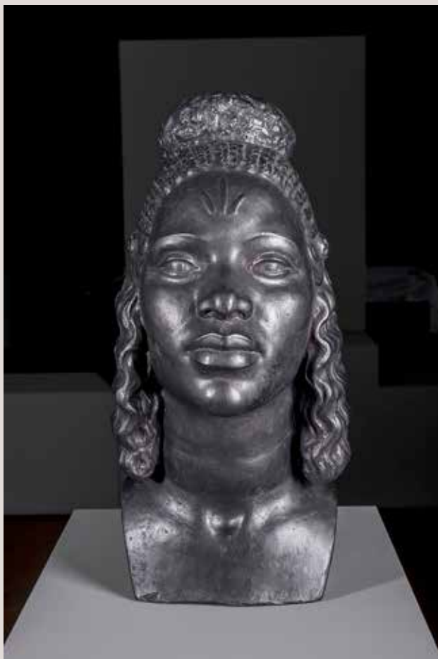
BUST MARE DE DÉU DE LA SELVA, 1934. Guix patinat, 53x25x29. Col·lecció Ajuntament d' Alcoi.