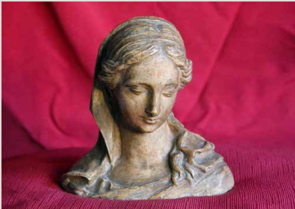
VERGE. Guix patinat, 15x16x8,5. Col·lecció Pérez-Peresejo (Madrid).