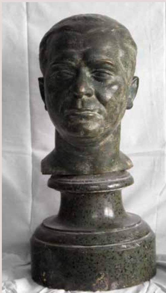
PAUSO, 1954. Bronze, 30x22x25. Col·lecció Pérez-Peresejo (Madrid).