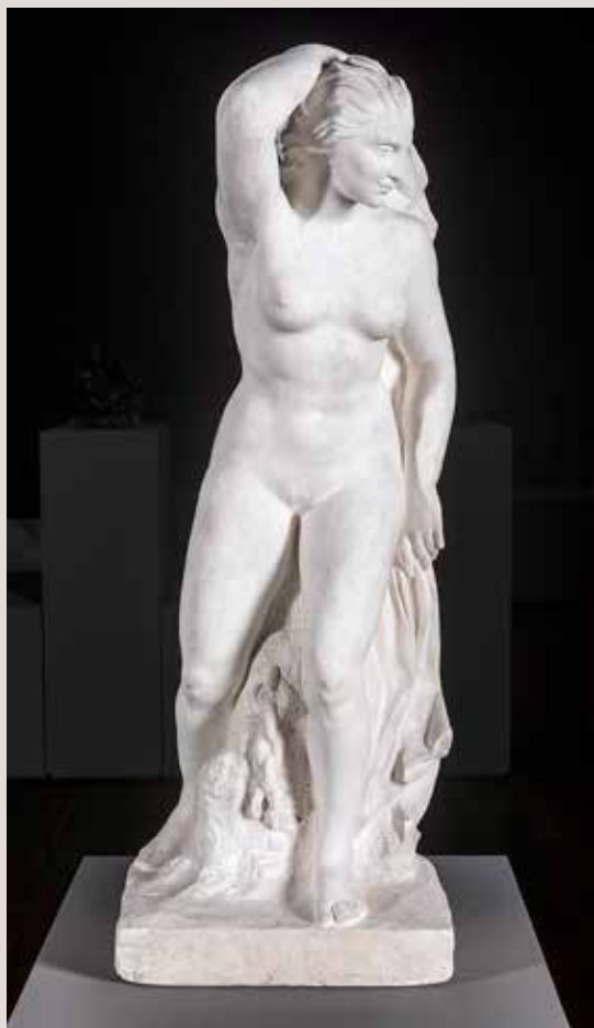
LLIBERTAT n° 3, 1917. Guix, 88x35x30. Col·lecció Ajuntament d'Alcoi.