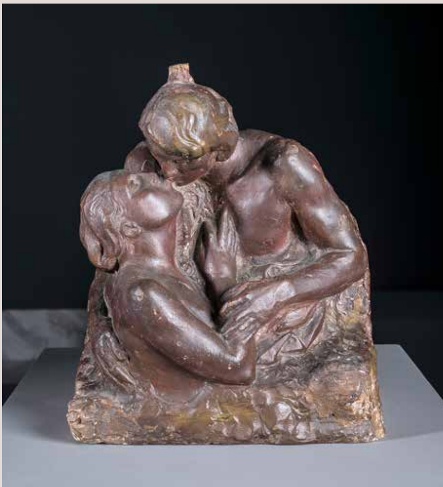
EL BES. Guix patinat, 34x26x18. Col·lecció Pérez-Peresejo (Madrid).