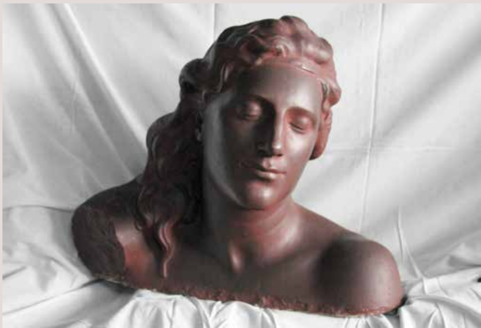
FRINÉ, 1915. Guix patinat, 46x56x47. Col·lecció Pérez-Peresejo (Madrid).