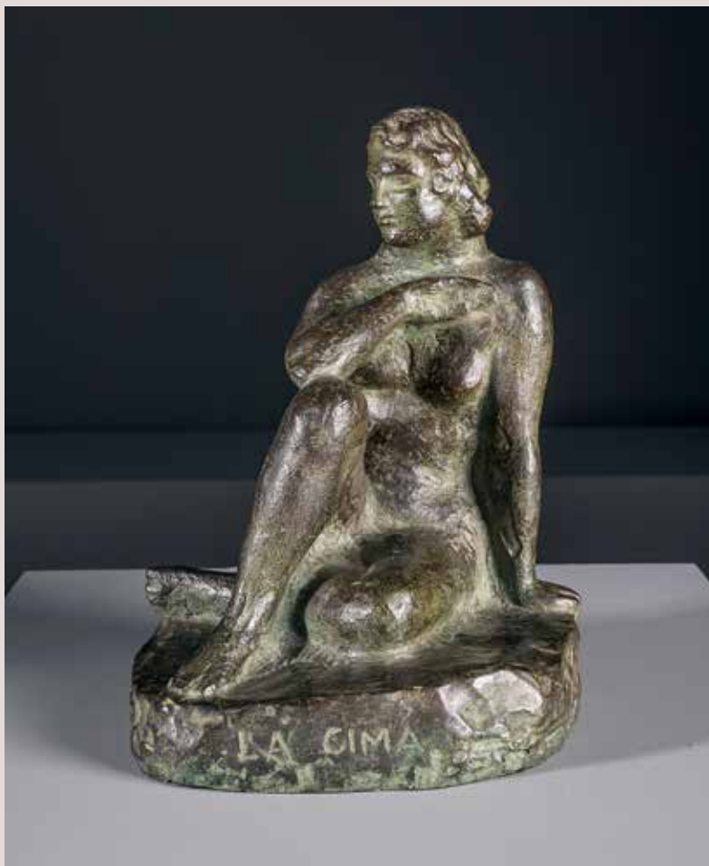
LA CIMA. Bronze. 28x22x17. Col·lecció Pérez-Peresejo (Madrid).