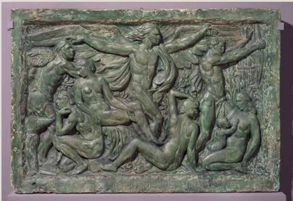
EL GENI DE LA VIDA, 1941. Guix patinat, 81x108x13. Col·lecció Pérez-Peresejo (Madrid).