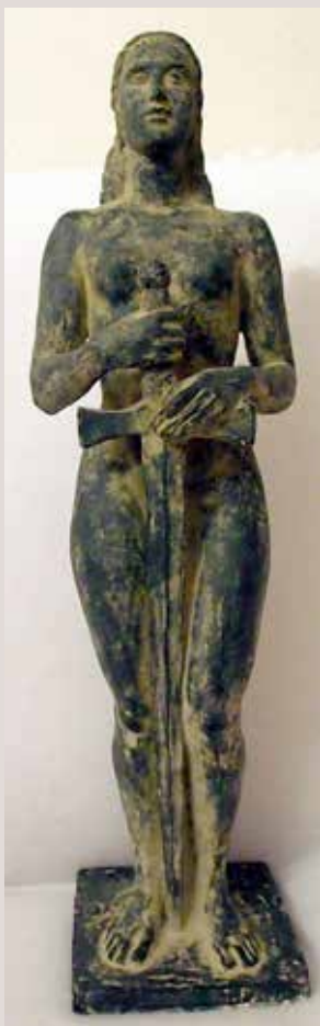
DAMA DE L'ESPASA. Guix patinat, 60x17,5x13. Col·lecció particular.