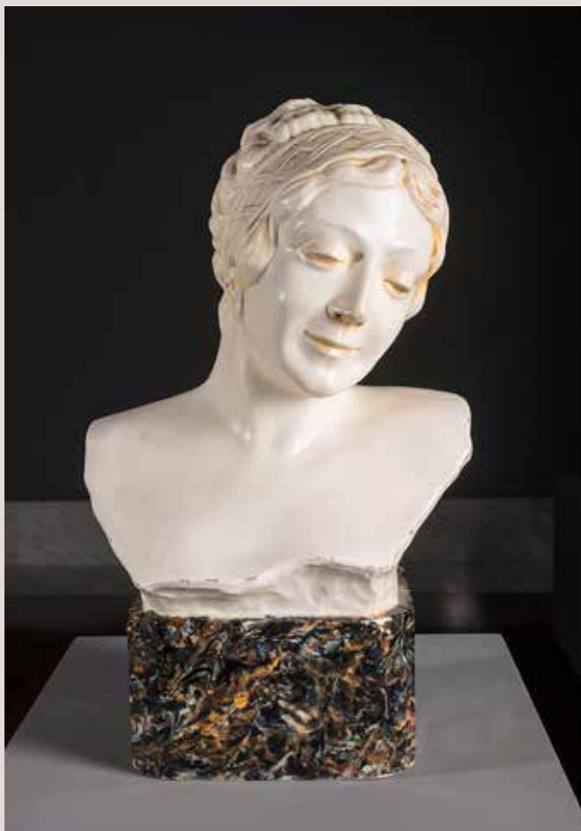
RETRAT DE ACTRIU. 1911 (Loreto Prado?). Guix patinat, 45x35x25. Col·lecció Pérez-Peresejo (Madrid).