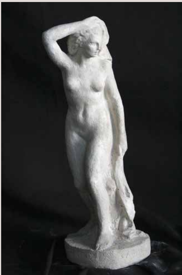
LLIBERTAT n° 1. Guix patinat, 41x15x16. Col·lecció Pérez-Peresejo (Madrid).