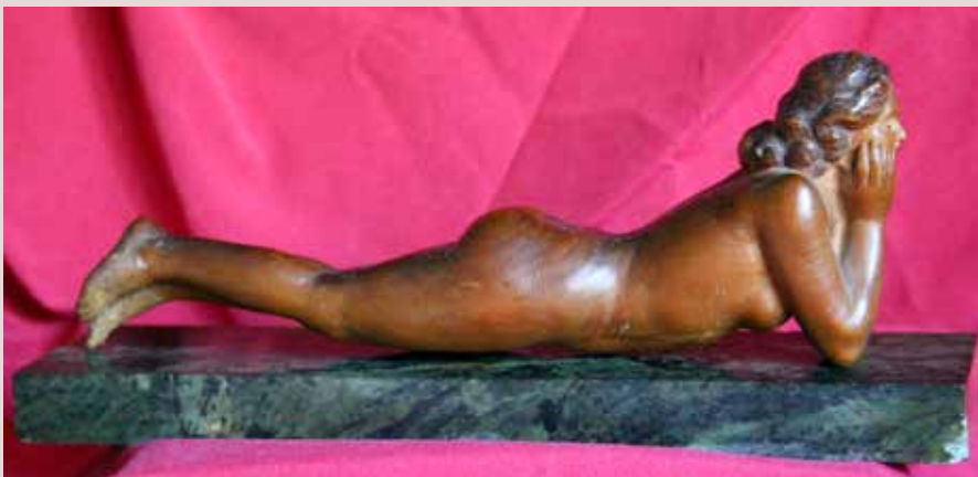
BANY DE SOL, 1950. Pi, 13x36,5x9,5. Col·lecció Pérez-Peresejo (Madrid).