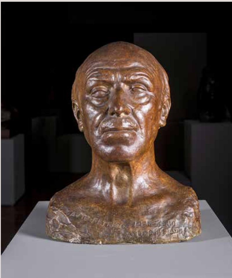
AUTORRETRAT, 1969. Guix patinat, 36,5x29x20. Col·lecció Pérez-Peresejo (Madrid).