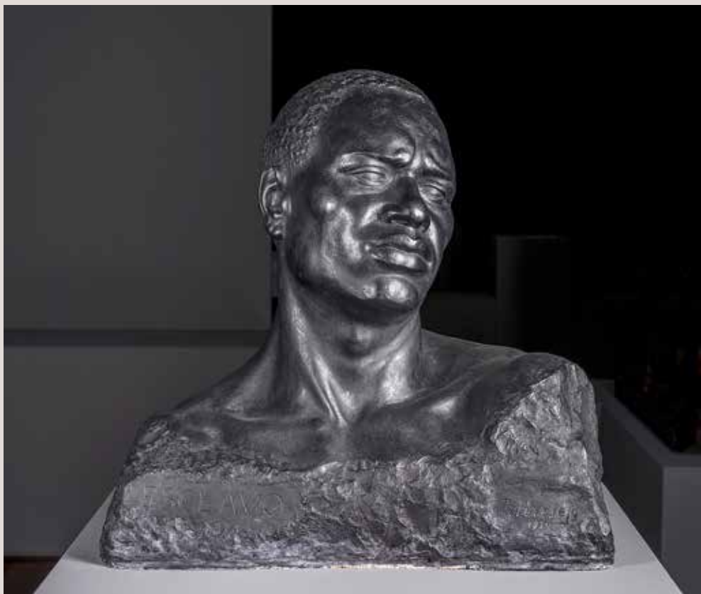
L'ESCLAU, 1920. Guix patinat, 50x51x30. Col·lecció Ajuntament d'Alcoi.