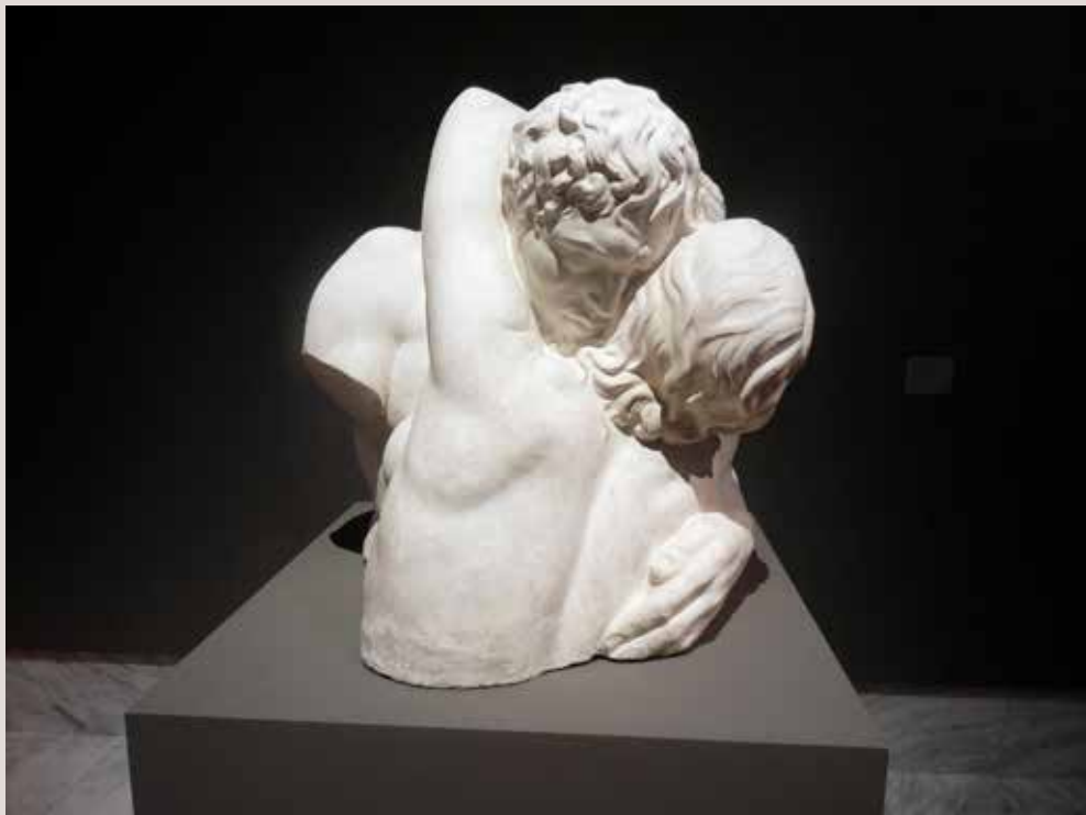
AMOR-NATURA, 1932. Guix, 86x87x78. Col·lecció Ajuntament d'Alcoi.