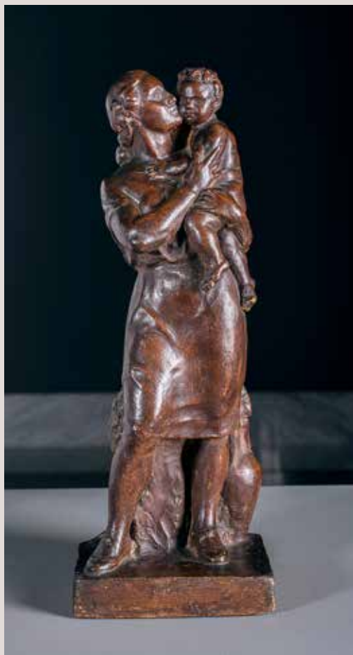
MATERNITAT. Guix patinat, 40x14,5x12. Col·lecció Pérez-Peresejo (Madrid).