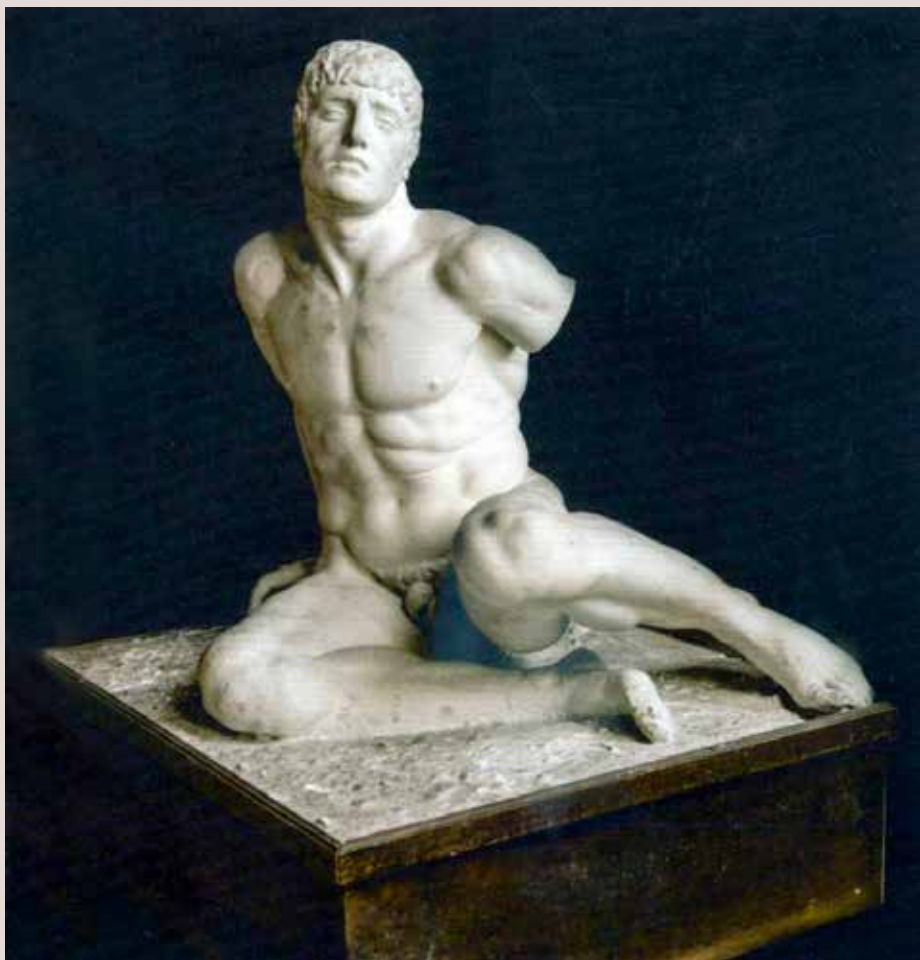
HEROI CAIGUT, 1915. Guix. Ajuntament d'Alcoi.