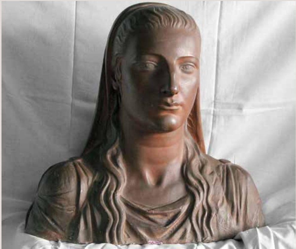
ABISSÍNIA, 1942. Guix patinat, 46x49x29. Col·lecció Pérez-Peresejo (Madrid).