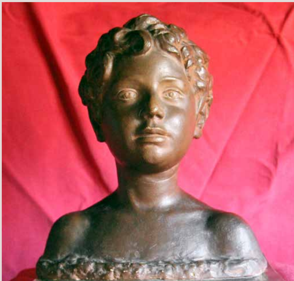
ALICIA 2, 1955. Guix patinat, 34x30x19. Col·lecció Pérez-Perejo (Madrid).