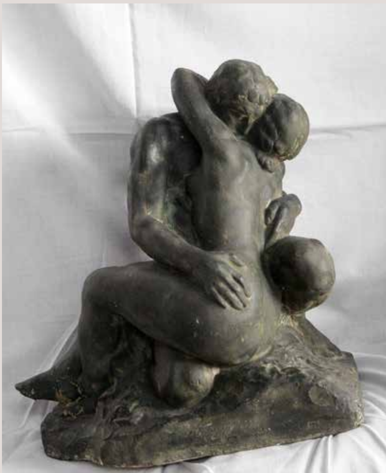
AMOR - NATURA 2. Guix patinat, 34x32x22. Col·lecció Pérez-Peresejo (Madrid).