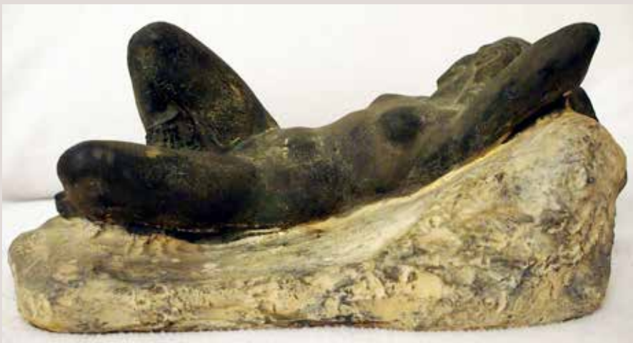
NU JACENT. Guix patinat, 14x32x17. Col·lecció particular.