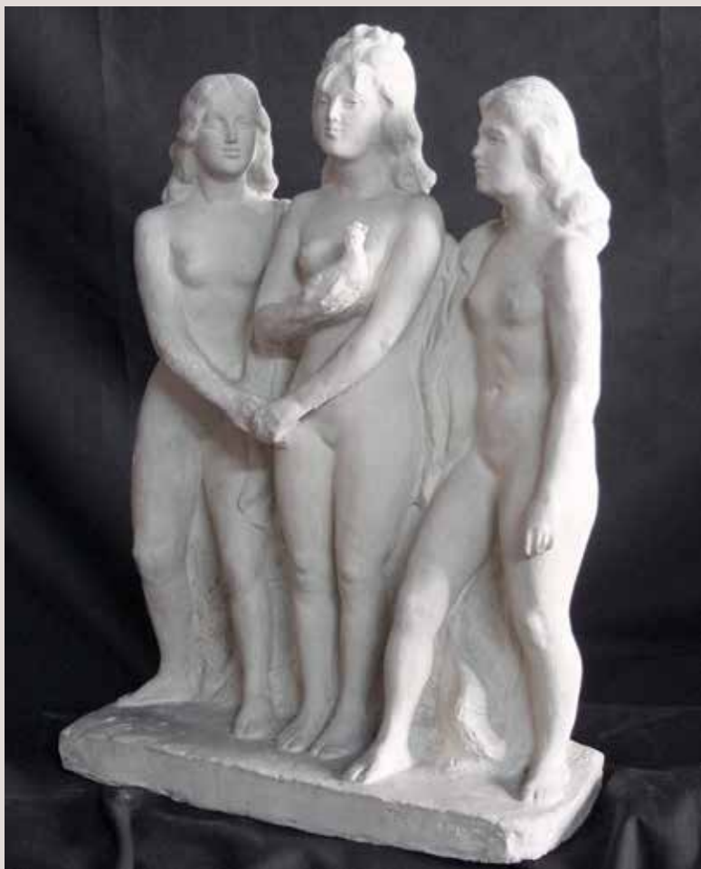
LES TRES GRÀCIES. Guix patinat, 48,5x34x19. Col·lecció Pérez-Peresejo (Madrid).