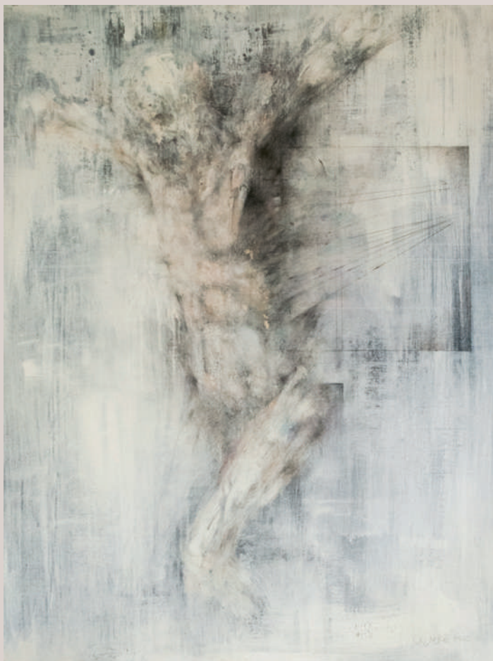
Del sofriment a la llum (Acrílic i llapis de color sobre cartó, 78x59cm)