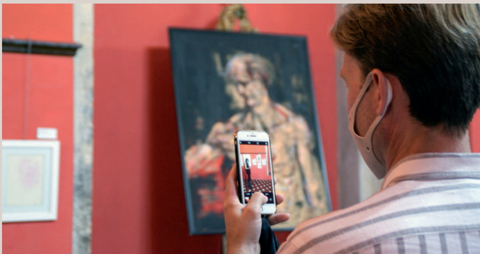
Presentació de l'exposició "Al voltant dels Borja" en el Palau Ducal dels Borja de Gandia

Res tornarà a ser igual en la vida d'Orfeu i la seua família quan, l'any 1996, cau malalt de tuberculosi; uns mesos i anys molt durs que afecten la seua salut, caràcter i personalitat. És ací quan comença a estudiar sobre el sentit de la vida i de l'art: l'ànima. Emprén un viatge cap a la transcendència, cap a l'espiritualitat: el cos és un mer contenidor farragós de l'ànima. Pateix. Fa mal. Però es feliç. Sap que a través de l'art pot alliberar la seua ànima dels contra-sentits físics. Prompte se submergeix en estudis bíblics, cabalístics, místics, òrfics i astronòmics basats en la ciència. Les suposicions o les malediccions queden eliminades del seu full de ruta.