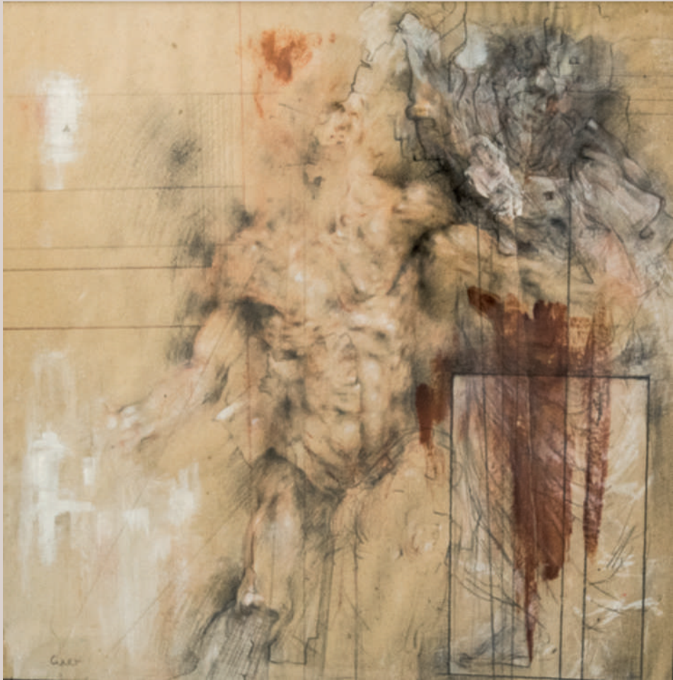
Company (Acrílic i llapis de color sobre paper, 62x62cm)