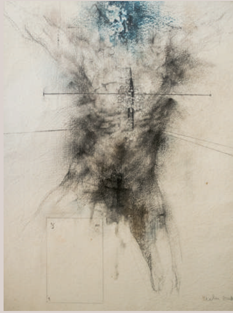
Ariel II (Acrílic i llapis de color sobre paper, 78x59cm)