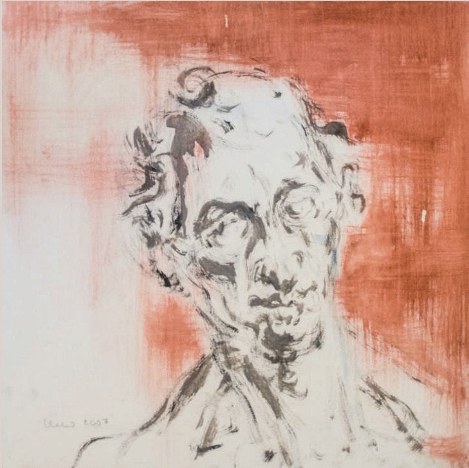
Profeta (Acrílic sobre llenç, 50x50cm)