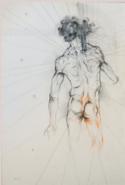
Història dels Borja (Acrílic i llapis aquarel·lable sobre llenç, 72x49cm)