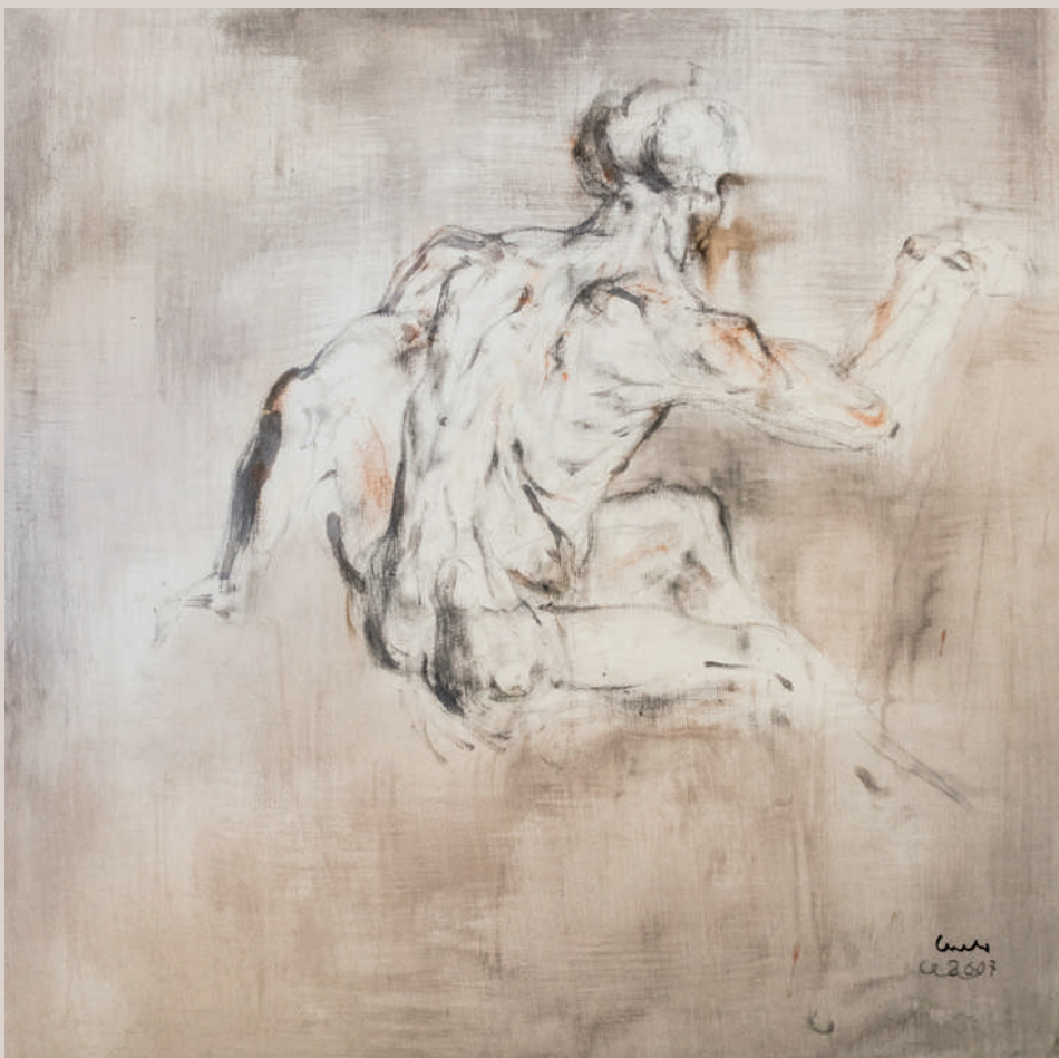
Esquena (Acrílic sobre llenç, 70x70cm)