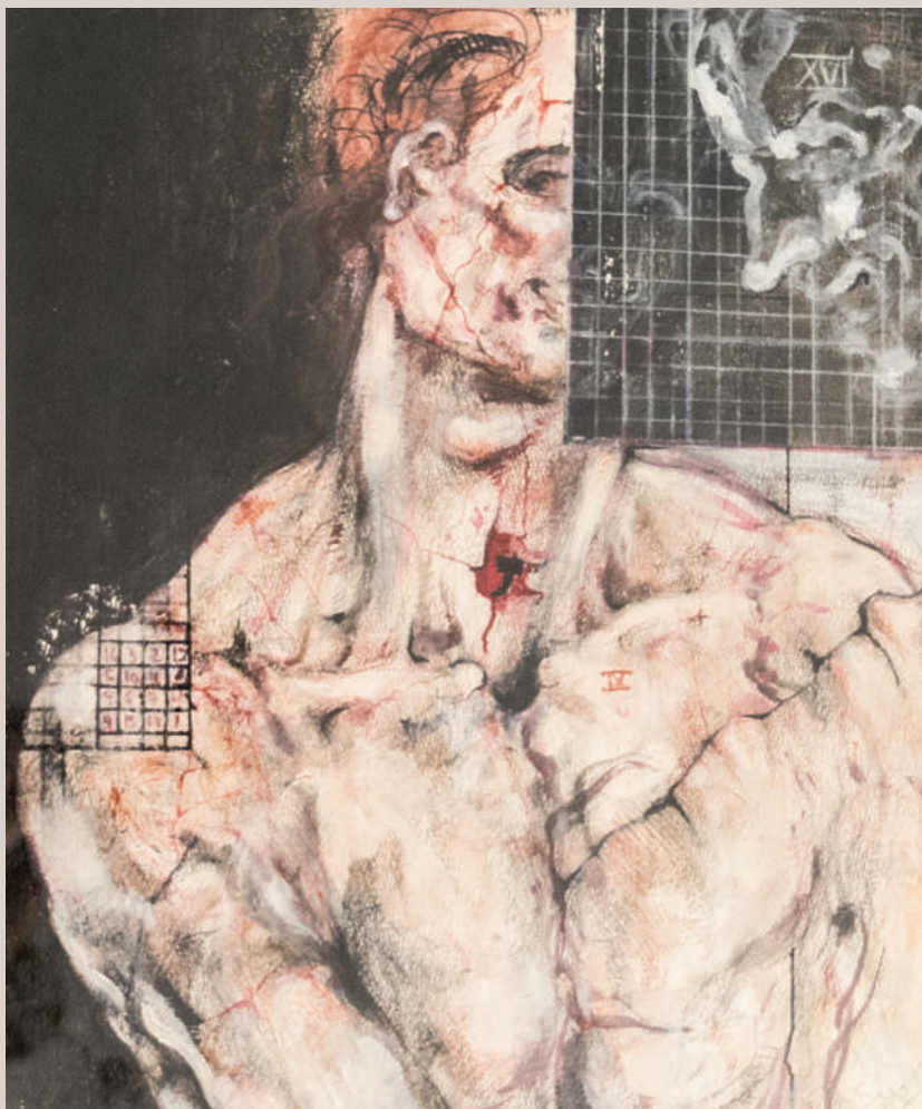
Addicte (Acrílic i llapis de color sobre paper, 45x37cm)