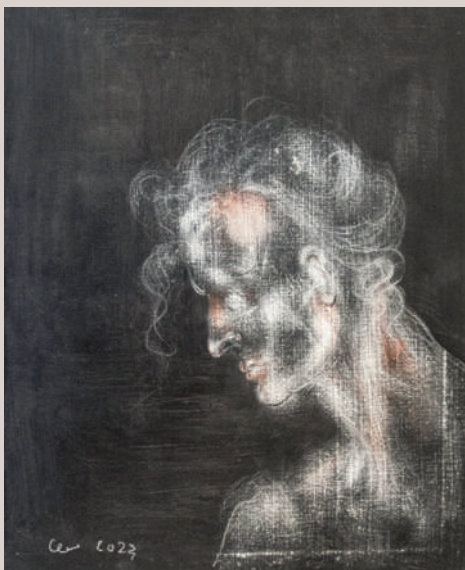
L'última mirada (Acrílic i llapis de color sobre llenç, 41x33cm)