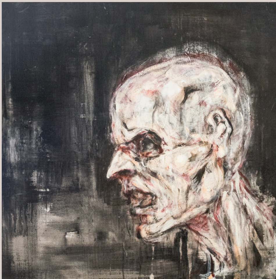
Èdip (Acrílic sobre llenç, 70x70cm)