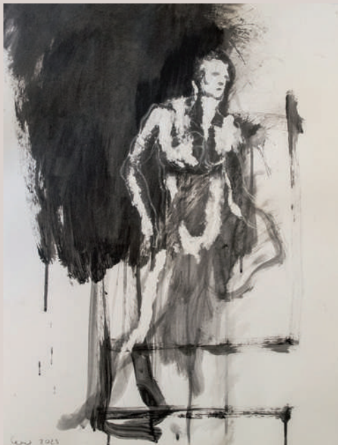
Estudi acadèmic de la follia (Acrílic i llapis de color sobre paper, 64,5x49,5cm)