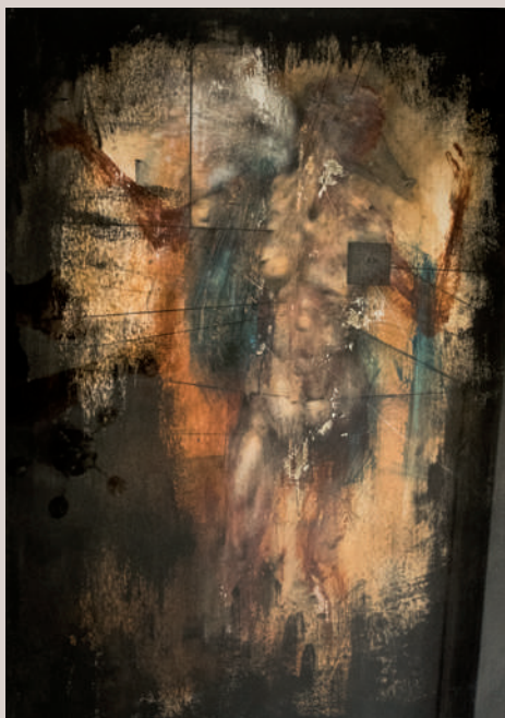
Guardià del llinard (Acrílic i llapis de color sobre cartó, 70x50 cm)