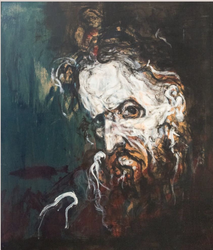
Hades (Acrílic sobre taula, 76x66cm)