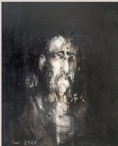
Temps (Acrílic sobre llenç, 41x33cm)