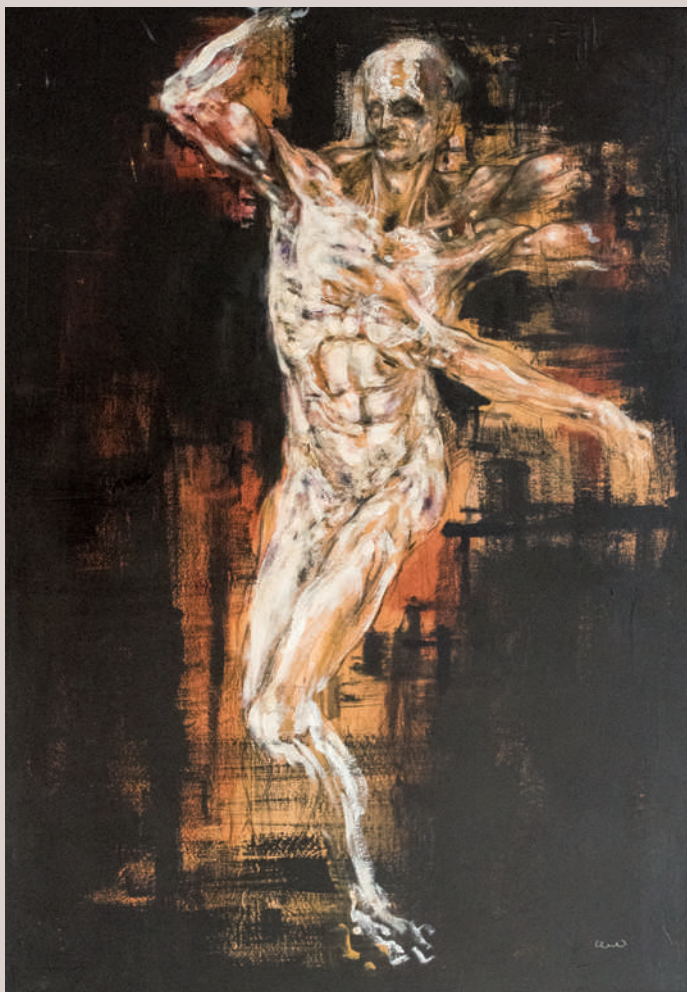
Serafi (Acrilic i llapis de color sobre taula, 100x70cm)