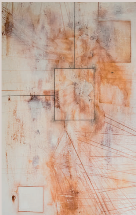
Travesant (Acrílic i llapis de color sobre cartó, 81x51cm)