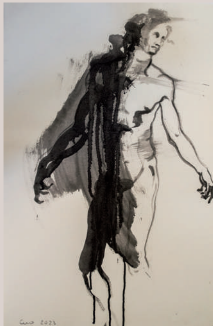
La meua ombra i jo (Acrílic sobre paper, 75,5x48cm)