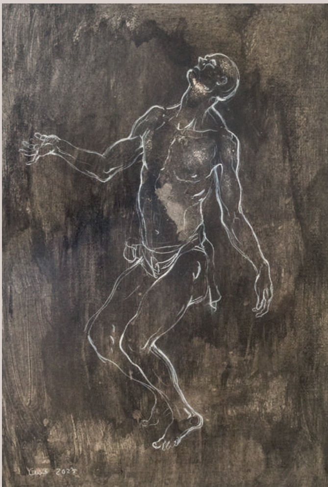
La nit oscura de l'ànima (Acrílic i llapis de color sobre cartó, 77x53cm)