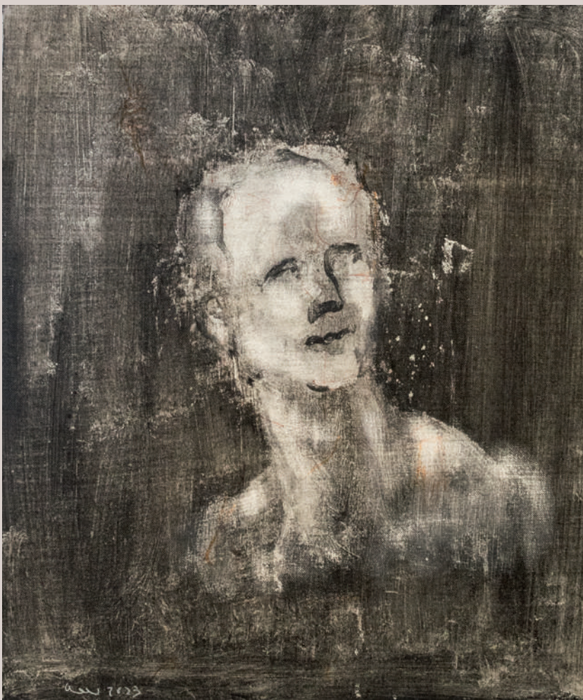
Estudi acadèmic de la pèrdua (Acrílic sobre llenç, 55x46cm)