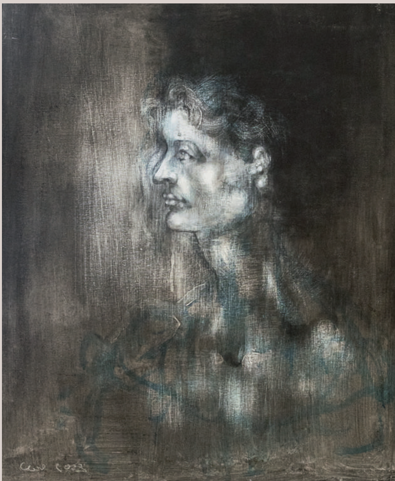
Memòria (Acrílic i bolígraf sobre llenç, 55x46cm)