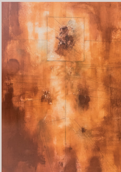
Òxid (Acrílic i llapis de color sobre cartó, 63x41cm)