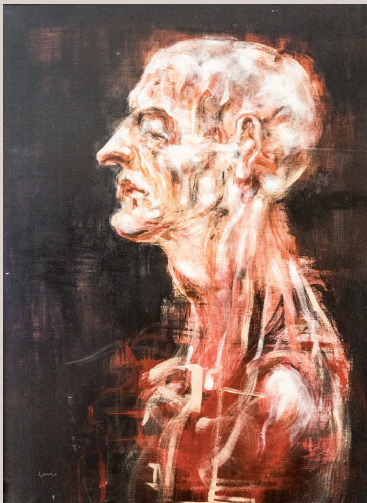
Savi món (Acrílic sobre llenç, 80x60cm)