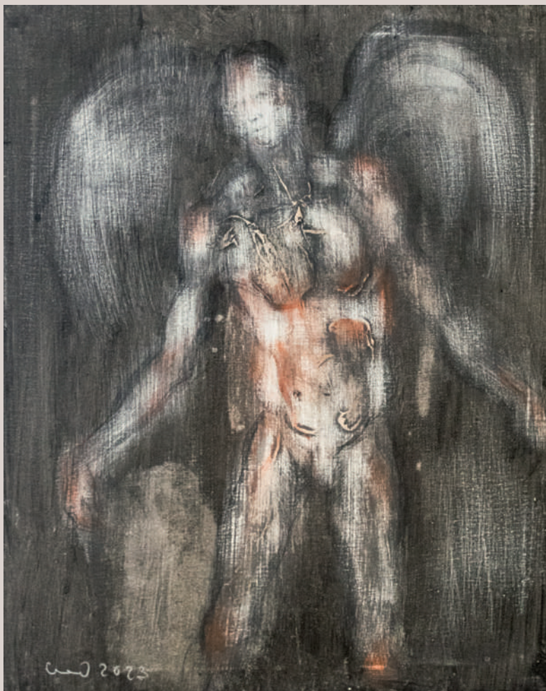
Àngel nocturn (Acrílic i llapis de color sobre llenç, 41x33cm)