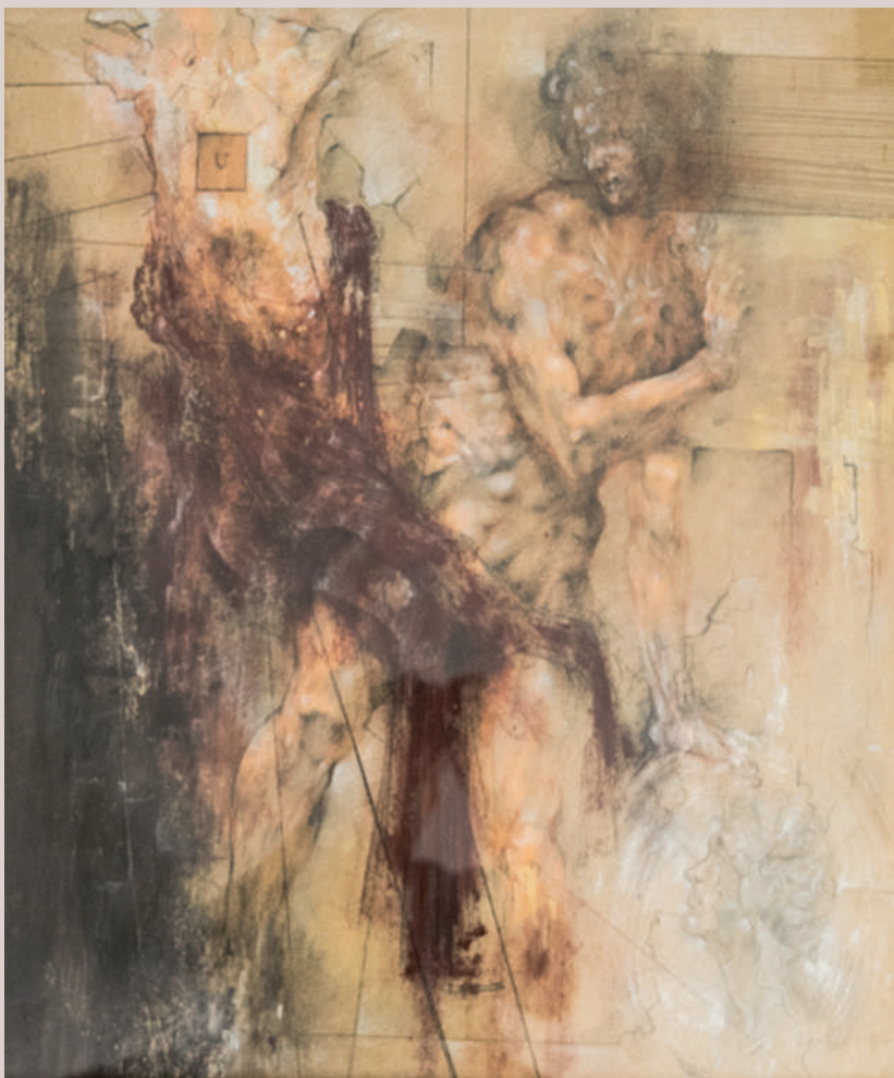
Áyax Telamoni (Acrílic i llapis de color sobre paper, 62x62cm)