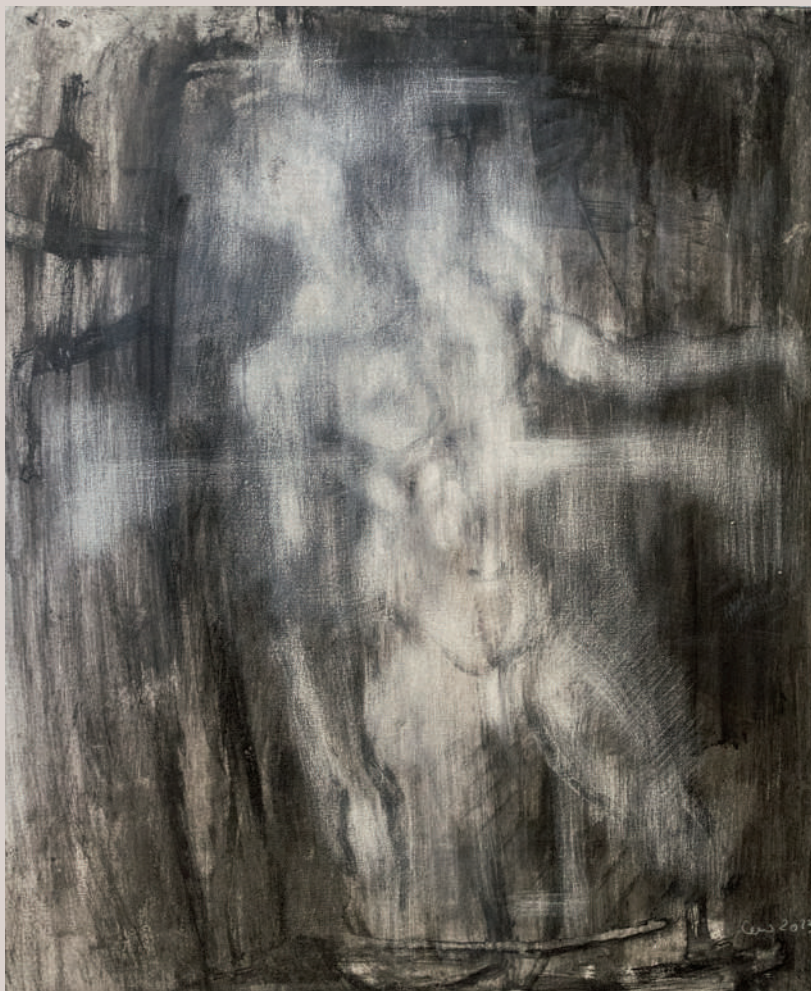
El que queda de mi (Acrílic sobre llenç, 73,5x60,5cm)