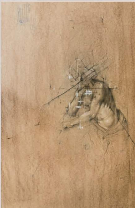
Esquerda del pensament (Acrílic i llapis de color sobre cartó, 85x55cm)