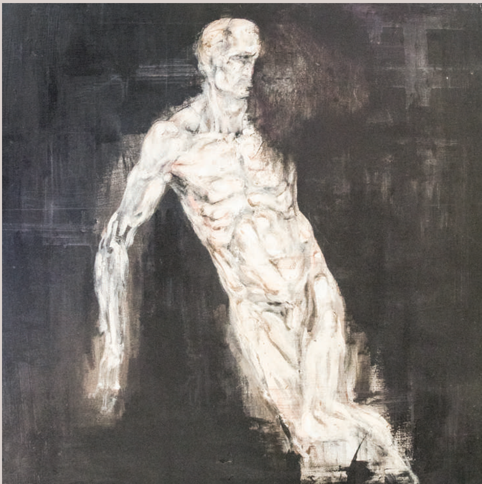
El viatge de l'ànima (Acrílic i llapis de color sobre llenç, 70x70cm)