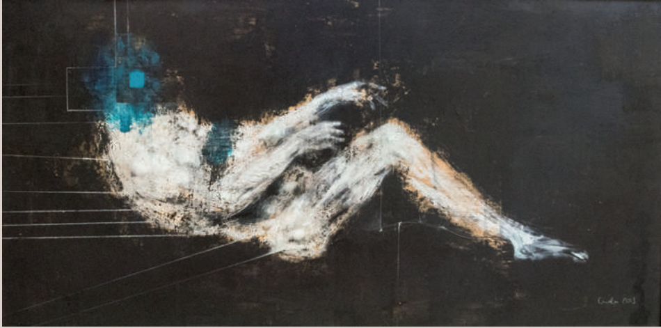
Insomne (Acrílic i llapis de color sobre taula, 129,5x68,5cm)