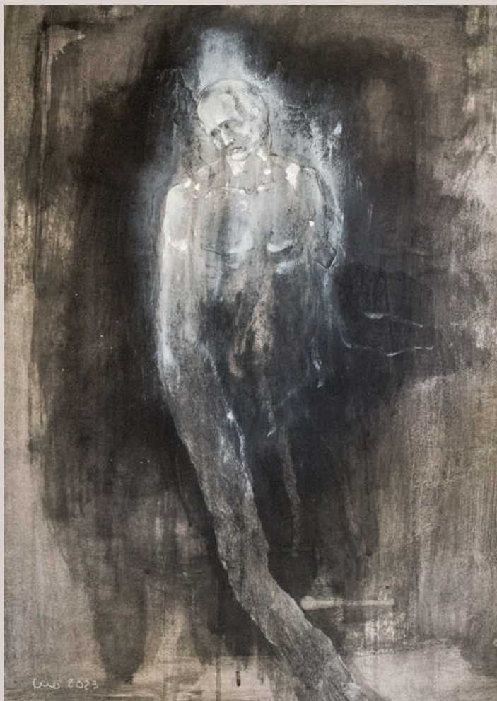
Eixint del món (Acrílic i llapis de color sobre cartó, 70x50cm)