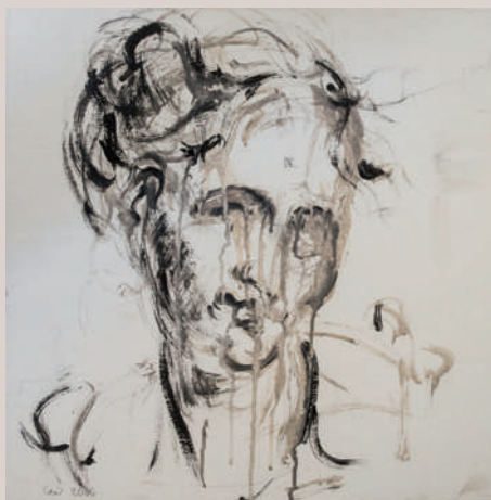
Safo (Acrílic sobre llenç, 50x50cm)