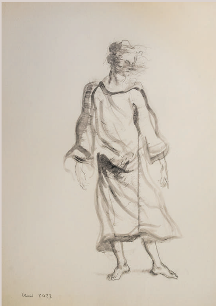
Ànima (Acrílic i llapis de color sobre paper, 70x50,5cm)