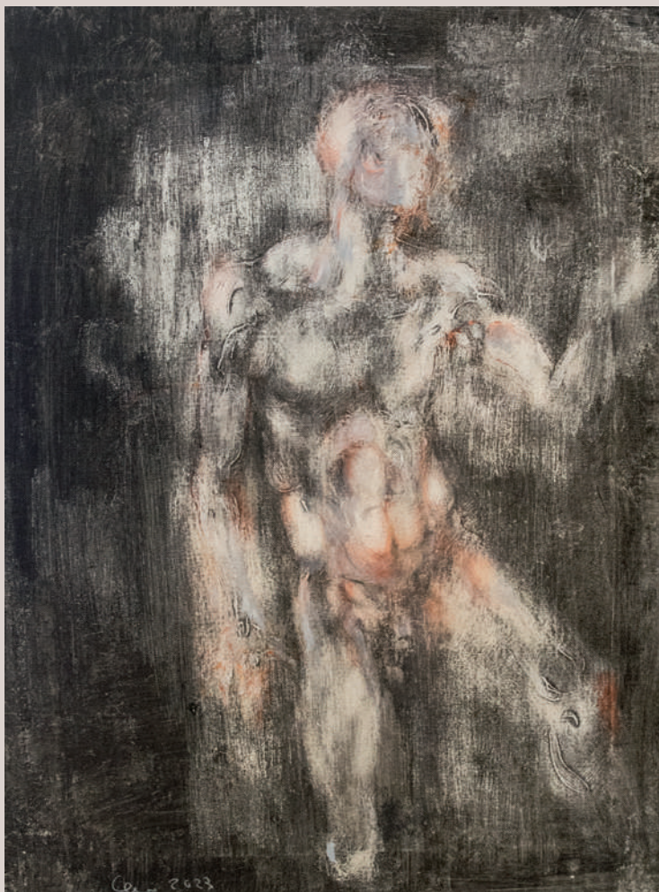
Estudi acadèmic de ningú (Acrílic sobre llenç, 61x46cm)