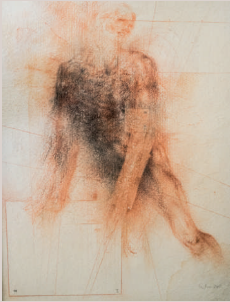
Ariel I (llapis de color sobre paper, 78x59cm)