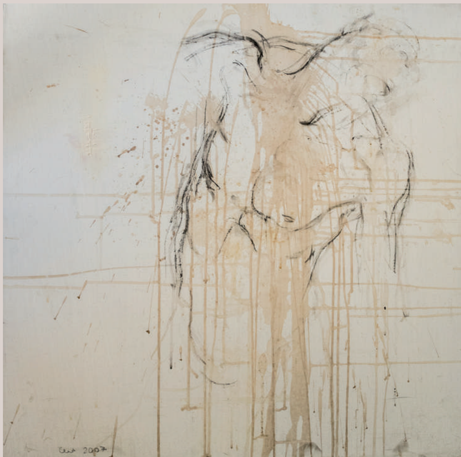
Vi (Carbonet i vi sobre llenç, 80x80cm)