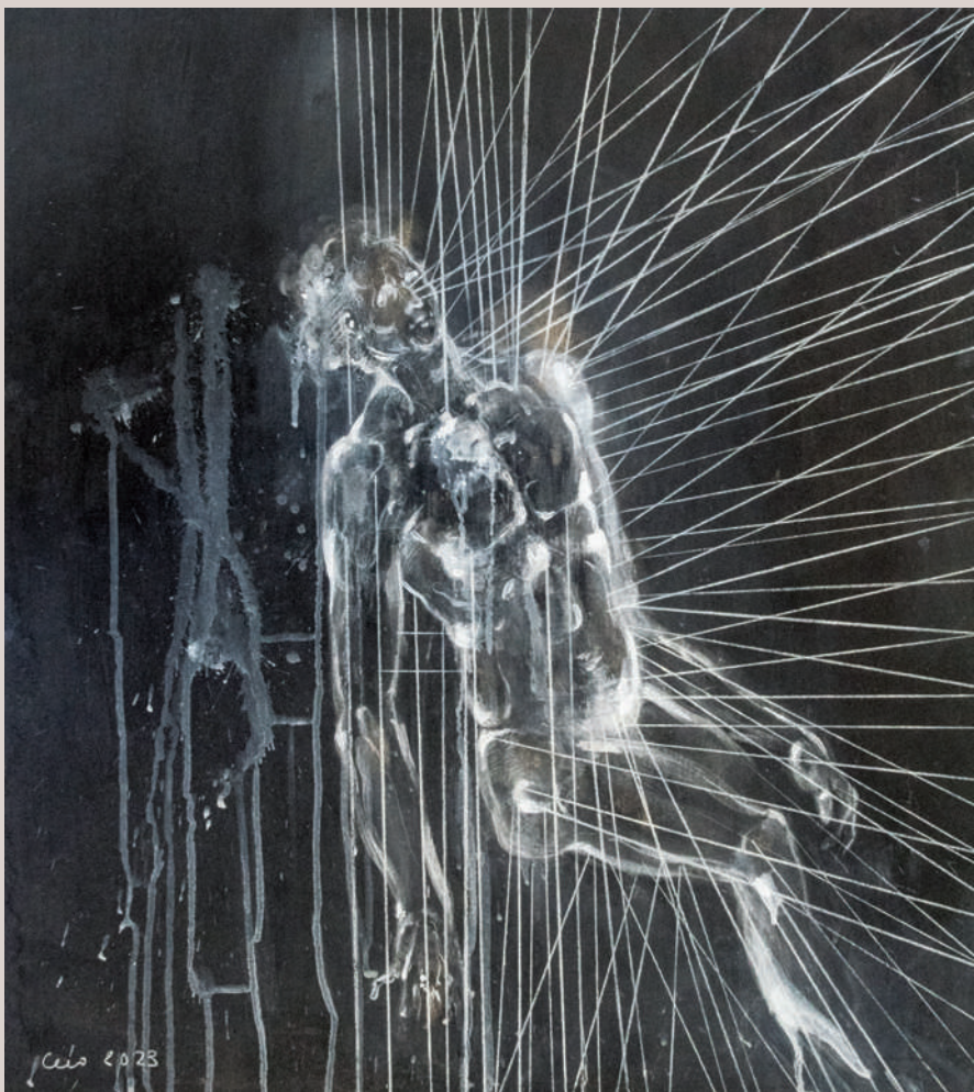
Elevació de l'ànima (Acrílic i llapis de color sobre taula, 58,5x52cm)