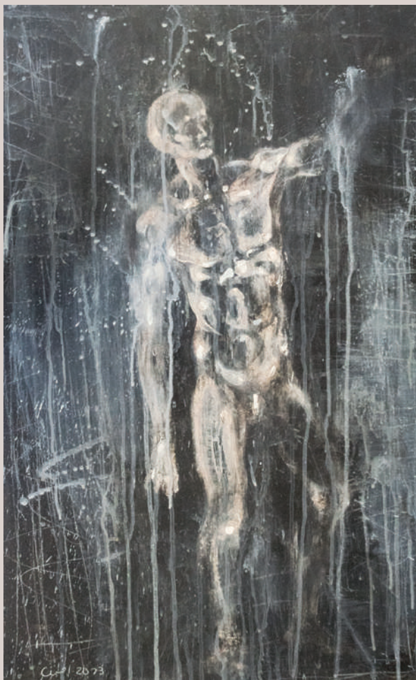
Una altra nit més (Acrílic i llapis de color sobre taula, 75,5x60,5cm)