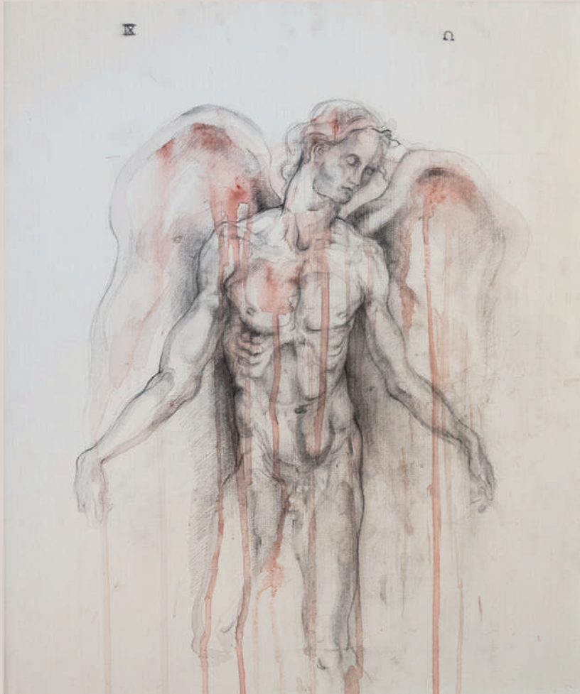
Àngel del temps (Acrílic i llapis aquarellable sobre llenç, 54x45cm)