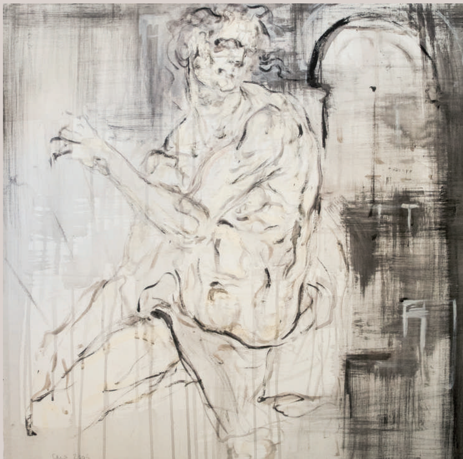
Orfeu eixint de l'Hades (Acrílic sobre llenç, 80x80cm)