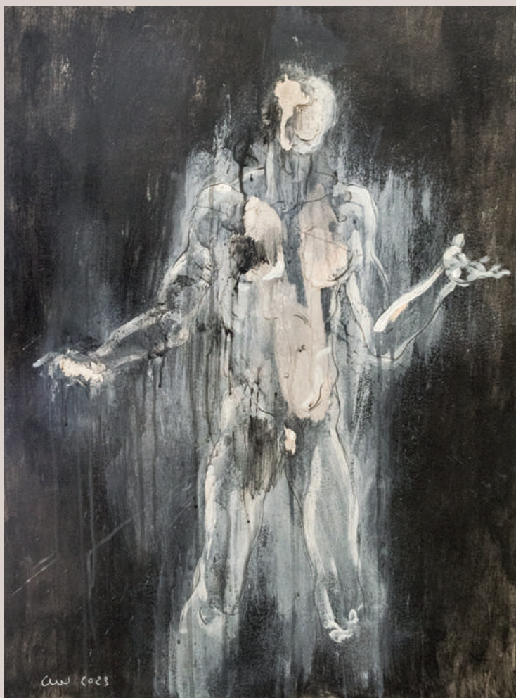
Com la vida em va passar per damunt (Acrílic i llapis de color sobre cartó, 74,5x56,5cm)