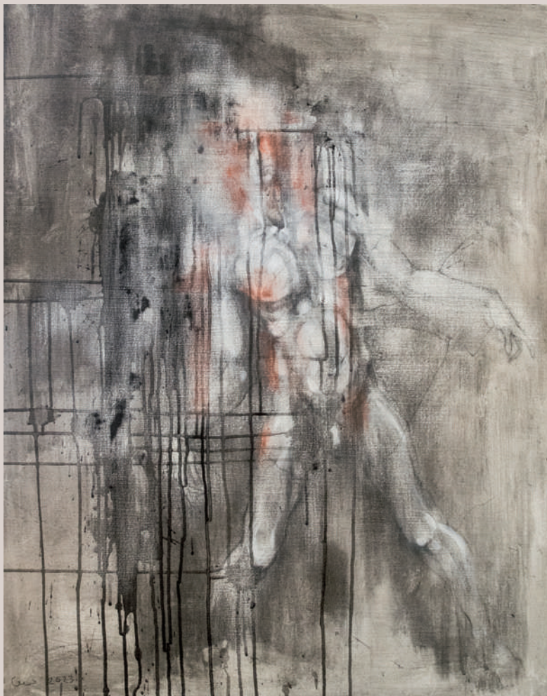
Entre ombres (Acrílic sobre llapis de color sobre llenç, 92x73cm)