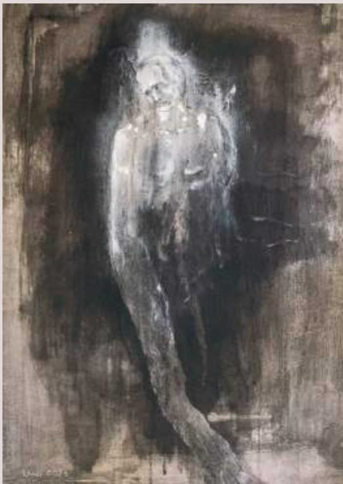
Serafí (Acrílic i llapis de color sobre taula, 100x70cm)