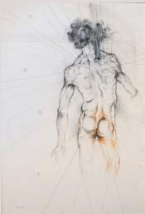
El que queda de mi (Acrílic sobre llenç, 73,5x60,5cm)