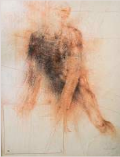
Elevació de l'ànima (Acrílic i llapis de color sobre taula, 58,5x52cm)