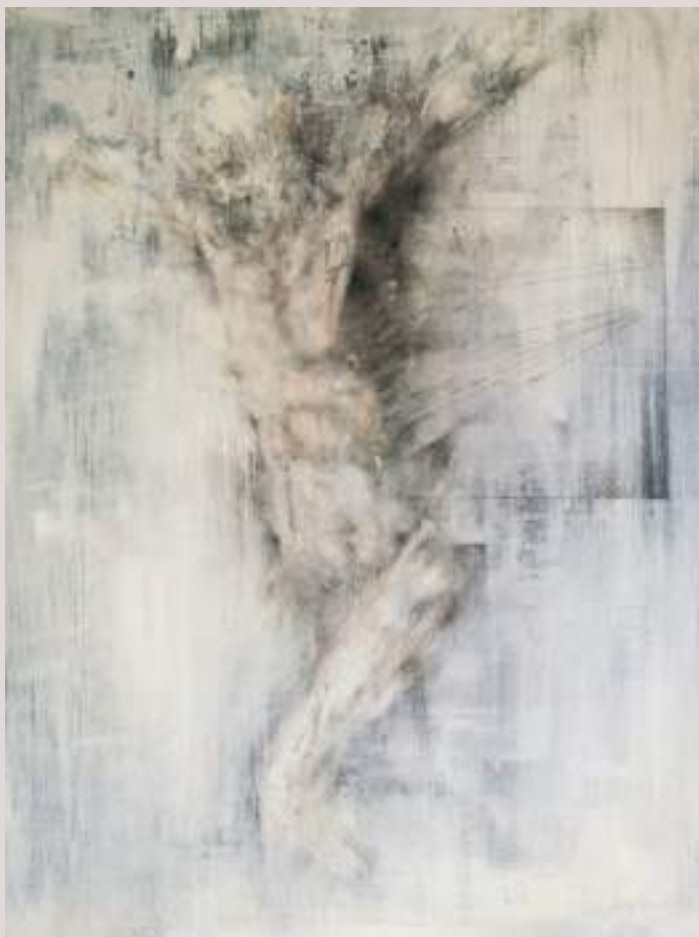
Com la vida em va passar per damunt (Acrílic i llapis de color sobre cartó, 74,5x56,5cm)