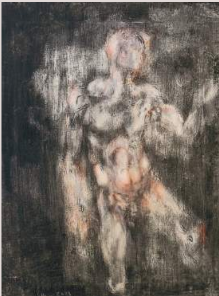
Orfeu eixint de l'Hades (Acrílic sobre llenç, 80x80cm)