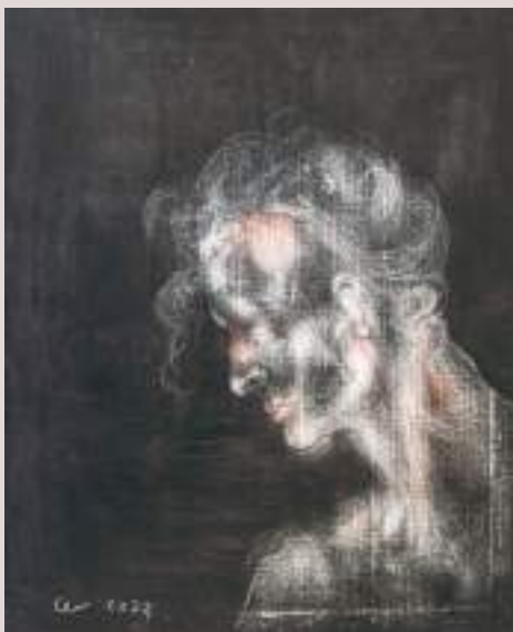
Guardià del llinar (Acrílic i llapis de color sobre cartó, 70x50cm)