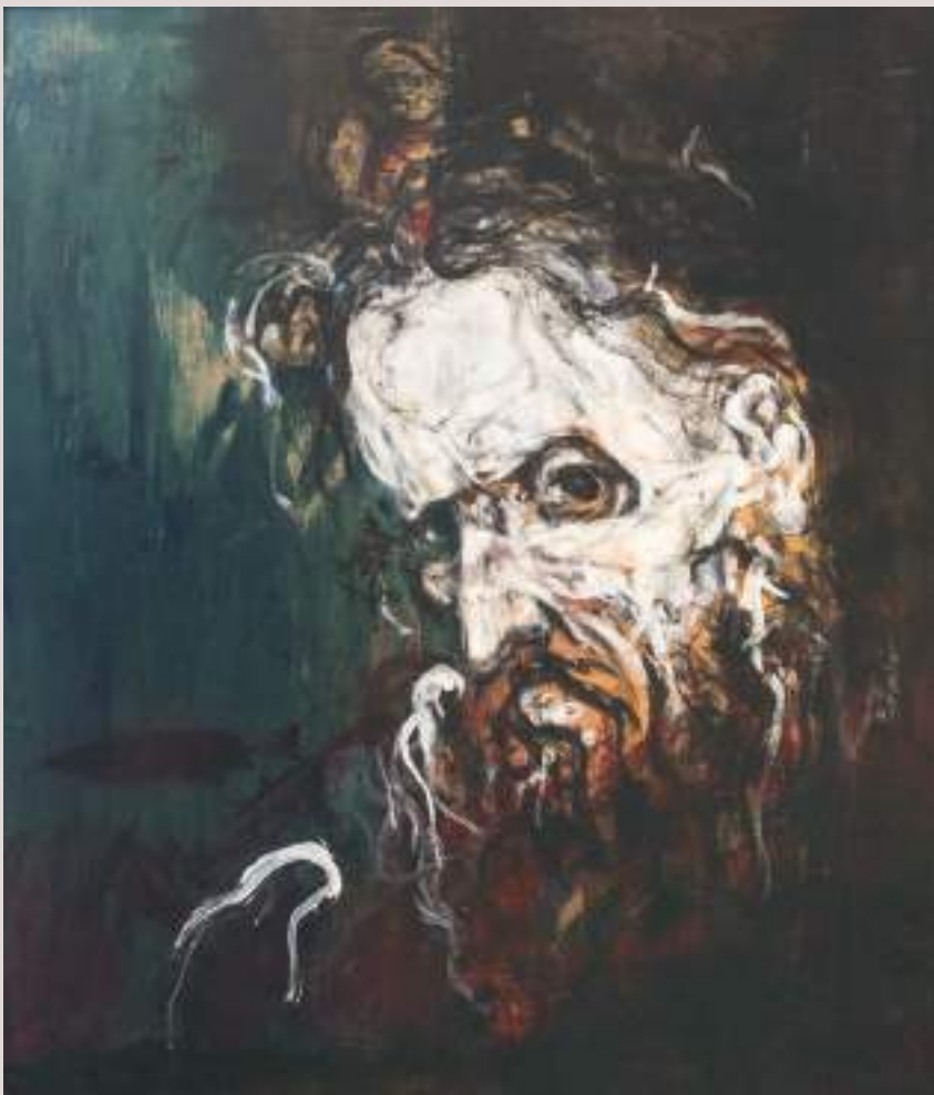
Temps (Acrílic sobre llenç, 41x33cm)