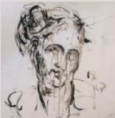
Estudi acadèmic de la follia (Acrílic i llapis de color sobre paper, 64,5x49,5cm)