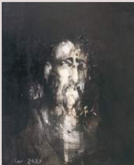
Òxid (Acrílic i llapis de color sobre cartó, 63x41cm)