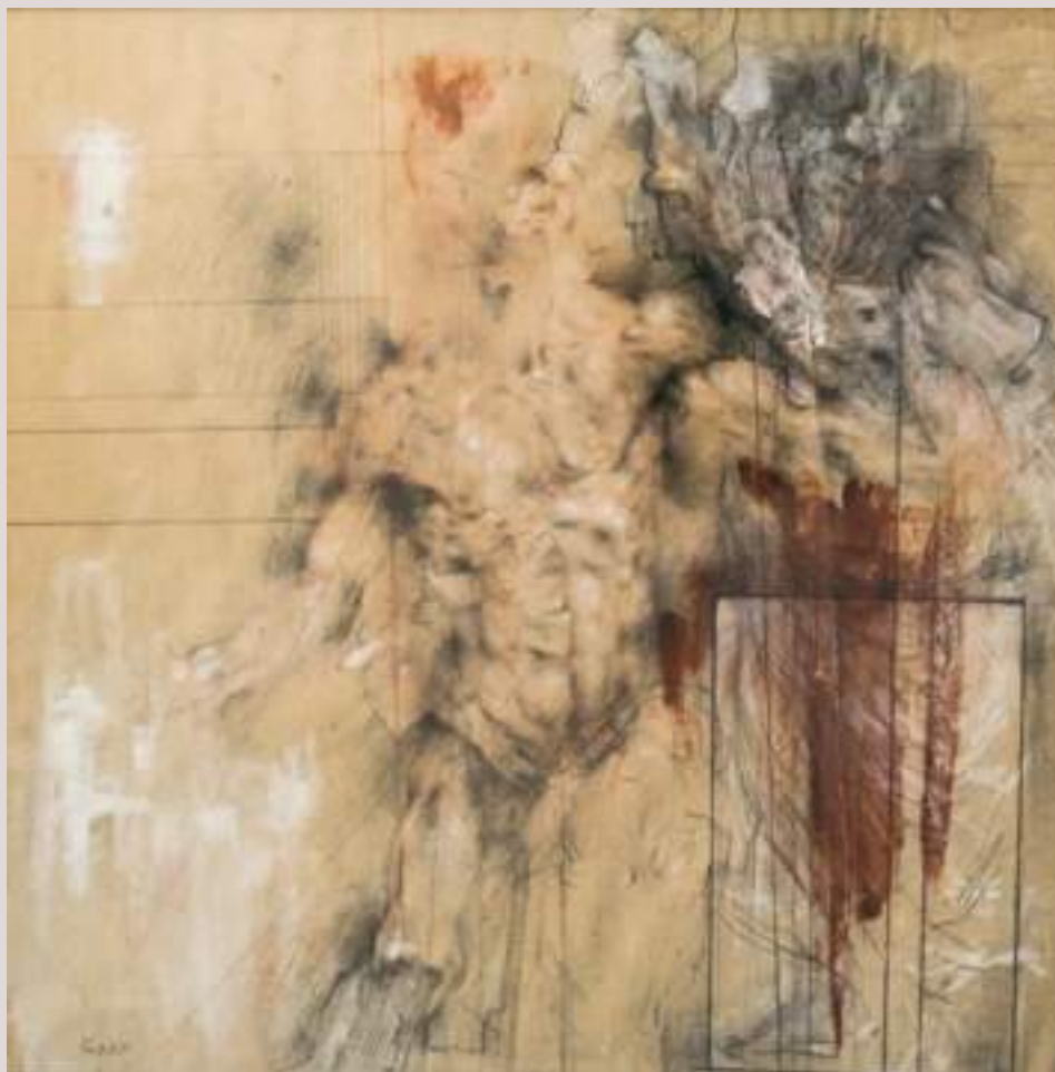
Història dels Borja (Acrílic i llapis aquarel·lable sobre lleng, 72x49cm)