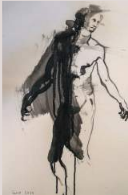
Company (Acrílic i llapis de color sobre paper, 62x62cm)