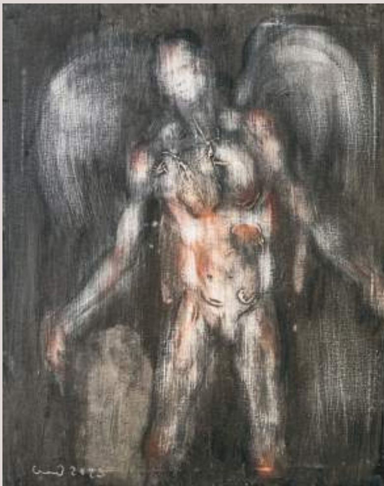
Áyax Telamoni (Acrílic i llapis de color sobre paper, 62x62cm)