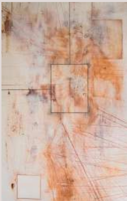
Una altra nit més (Acrílic i llapis de color sobre taula, 75,5x60,5cm)