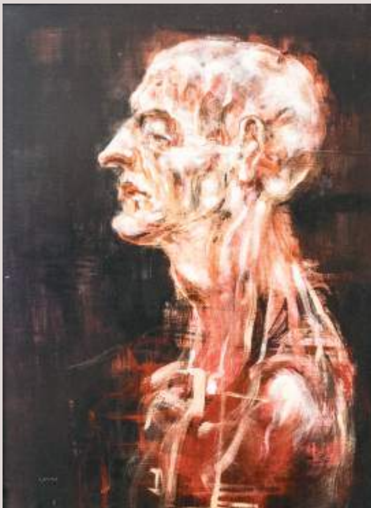
L'última mirada (Acrílic i llapis de color sobre llenç, 41x33cm)