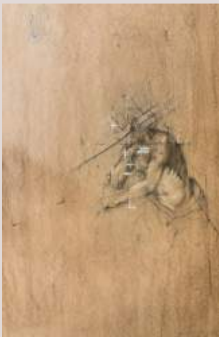
Esquena ferida (Acrílic i llapis de color cartó, 57x42cm)