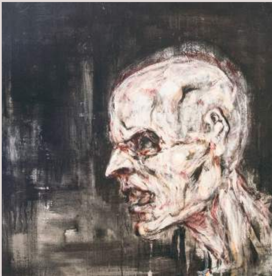
Àngel nocturn (Acrílic i llapis de color sobre llenç, 41x33cm)