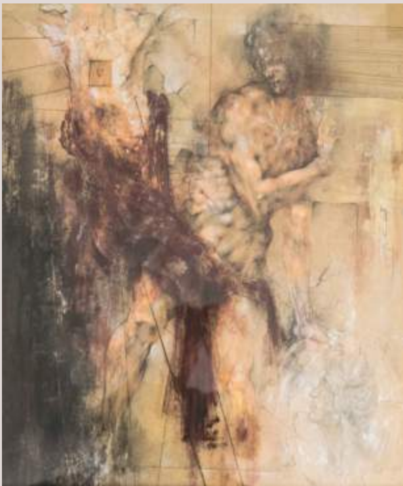
Ariel I (llapis de color sobre paper, 78x59cm)