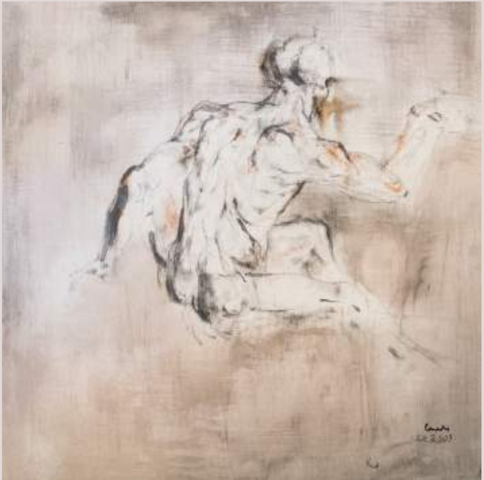
Estudi acadèmic de ningú (Acrílic sobre llenç, 61x46cm)