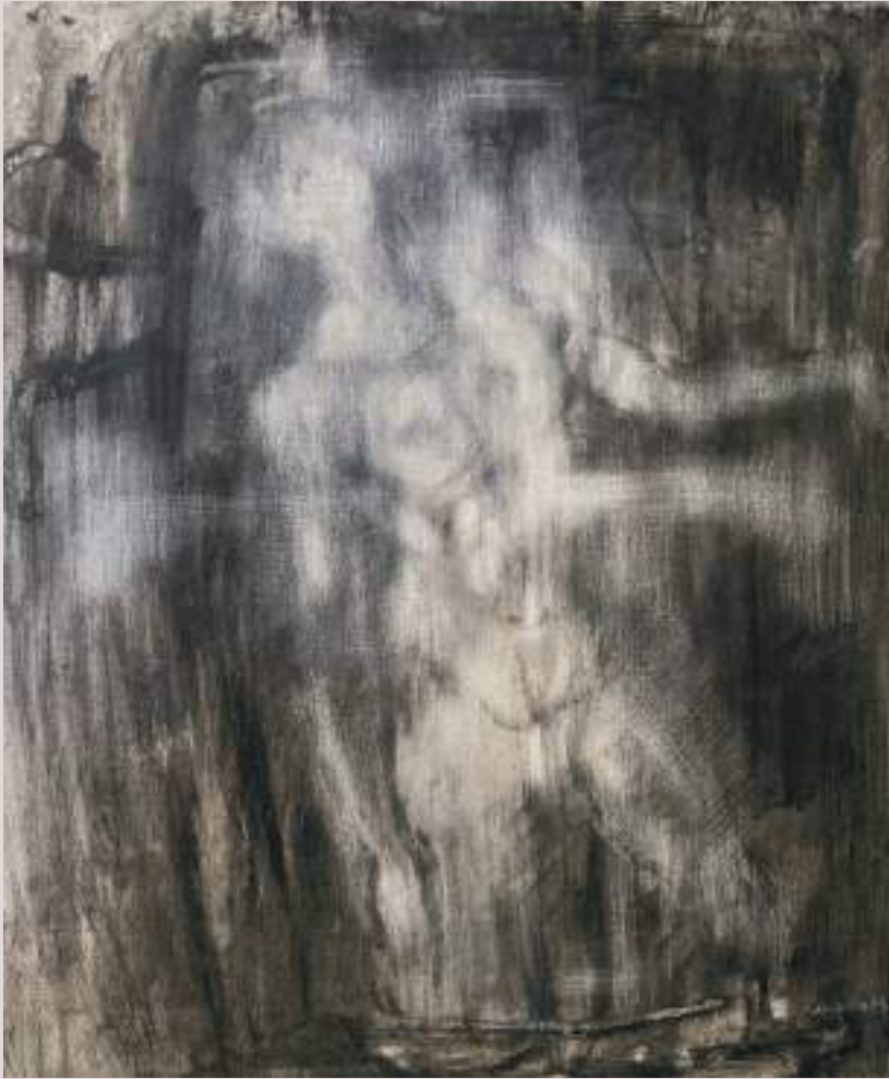
Del sofriment a la llum (Acrílic i llapis de color sobre cartó, 78x59cm)