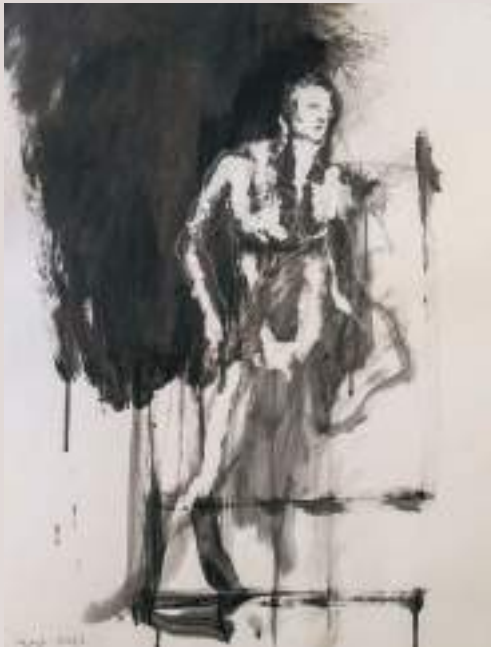
Profeta (Acrílic sobre llenç, 50x50cm)