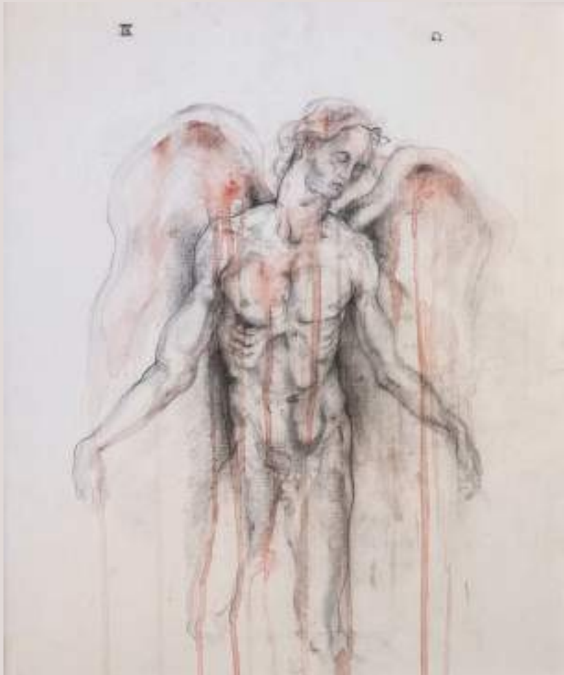
Entre ombres (Acrílic sobre llapis de color sobre llenç, 92x73cm)