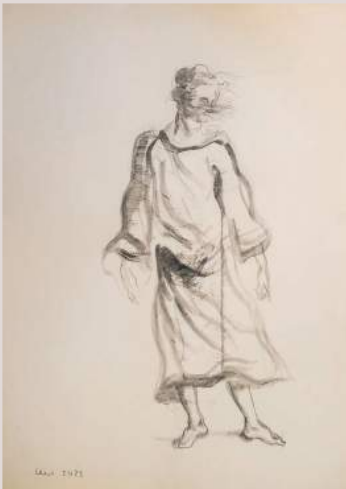
Addicte (Acrílic i llapis de color sobre paper, 45x37cm)