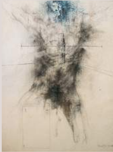
Eixint del món (Acrílic i llapis de color sobre cartó, 70x50cm)