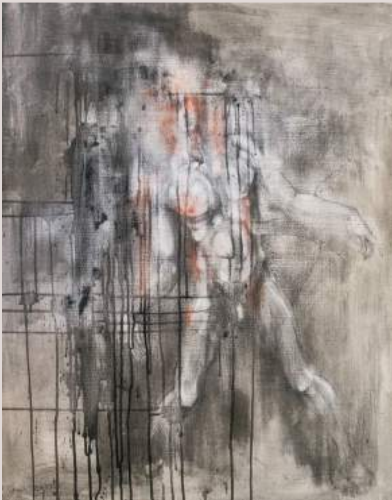
Èdip (Acrílic sobre llenç, 70x70cm)