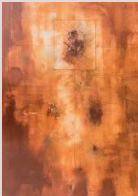
El viatge de l'ànima (Acrílic i llapis de color sobre llenç, 70x70cm)