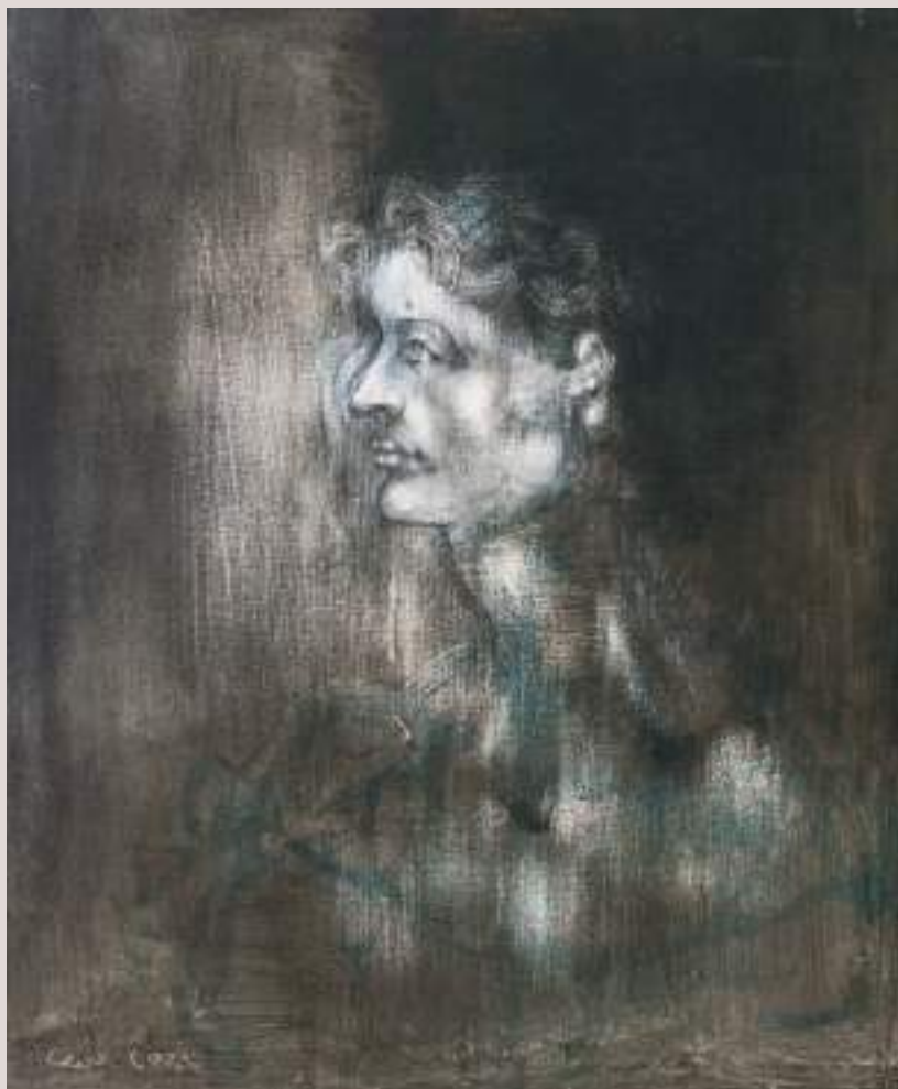
Tirèsies (Acrílic sobre llenç, 80x80cm)