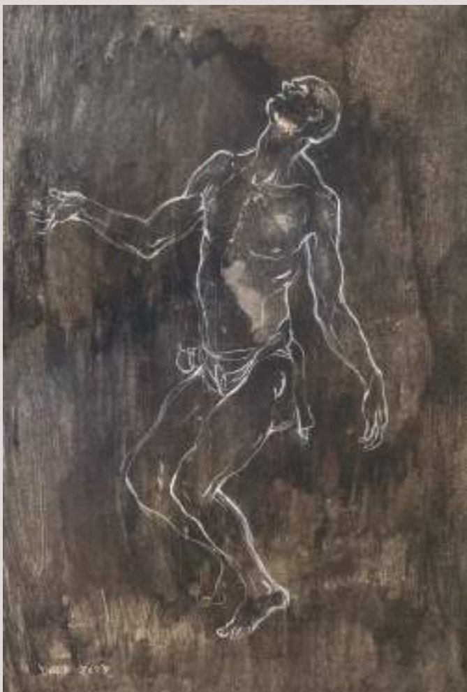
Esquena (Acrílic sobre llenç, 70x70cm)