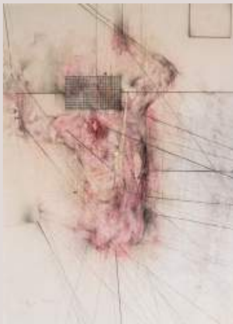
Àngel del temps (Acrílic i llapis aquarel·lable sobre llenç, 54x45cm)