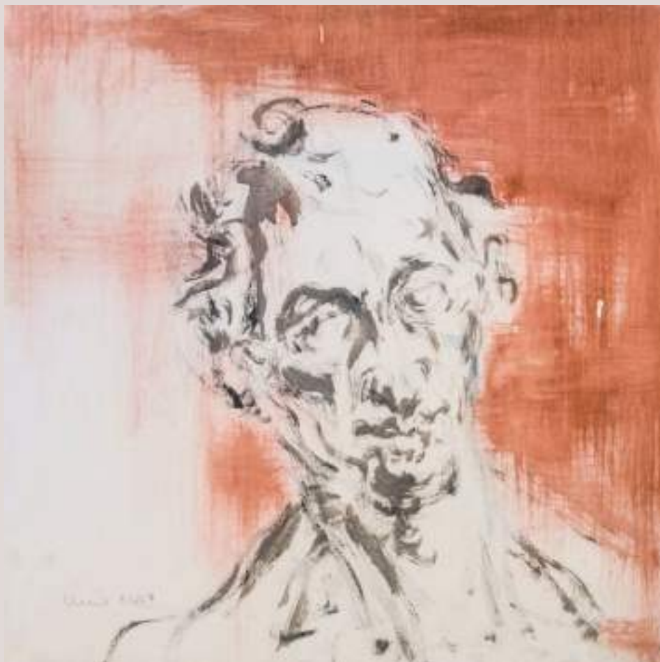
La meua ombra i jo (Acrylic sobre paper, 75,5x48cm)