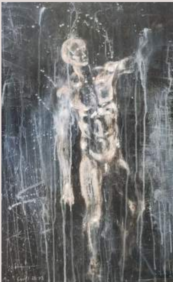
Savi món (Acrílic sobre llenç, 80x60cm)