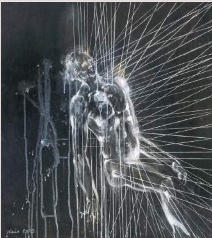
Hades (Acrílic sobre taula, 76x66cm)