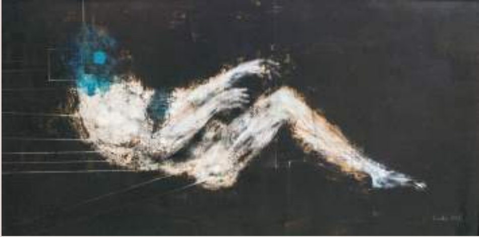
Esquerra del pensament (Acrílic i llapis de color sobre cartó, 85x55cm)