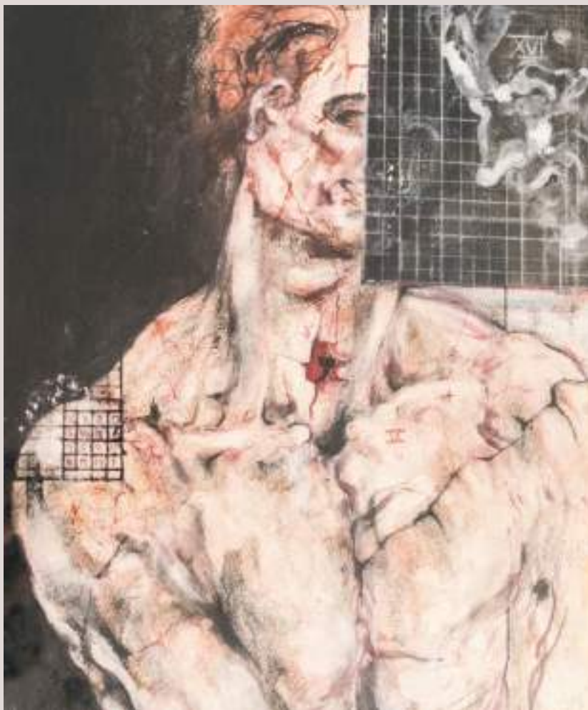
Travesant (Acrílic i llapis de color sobre cartó, 81x51cm)