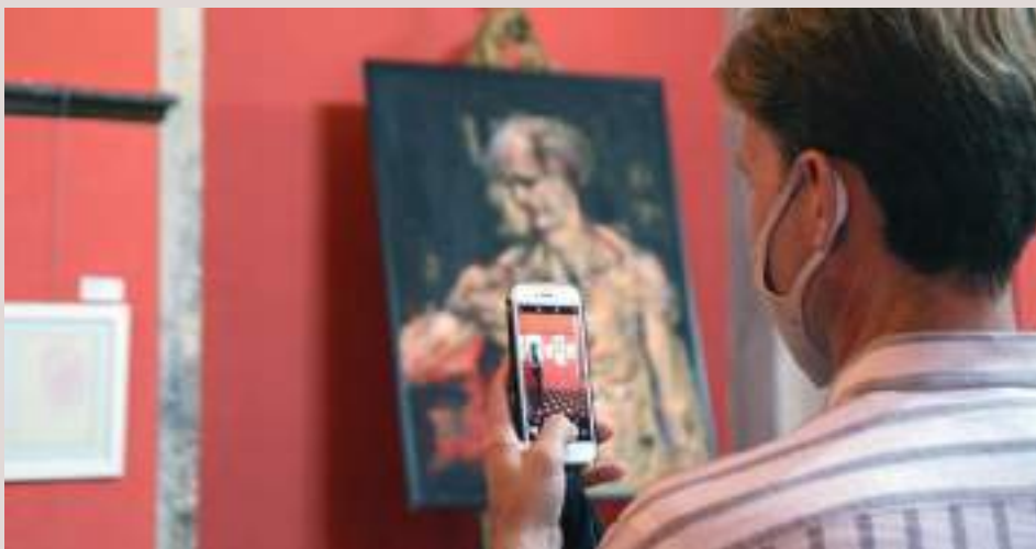
Presentació de l'exposició "Al voltant dels Borja" en el Palau Ducal dels Borja de Gandia

Res tornarà a ser igual en la vida d'Orfeu i la seua família quan, l'any 1996, cau malalt de tuberculosi; uns mesos i anys molt durs que afecten la seua salut, caràcter i personalitat. És ací quan comença a estudiar sobre el sentit de la vida i de l'art: l'ànima. Emprén un viatge cap a la transcendència, cap a l'espiritualitat: el cos és un mer contenidor farragós de l'ànima. Pateix. Fa mal. Però es feliç. Sap que a través de l'art pot alliberar la seua ànima dels contra-sentits físics. Prompte se submergeix en estudis bíblics, cabalístics, místics, òrfics i astronòmics basats en la ciència. Les suposicions o les malediccions queden eliminades del seu full de ruta.