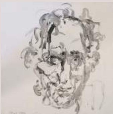
Estudi acadèmic de la pèrdua (Acrílic sobre llenç, 55x46cm)