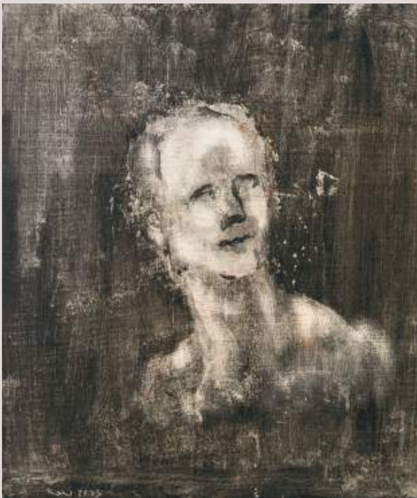
Safo (Acrílico sobre llenç, 50x50cm)