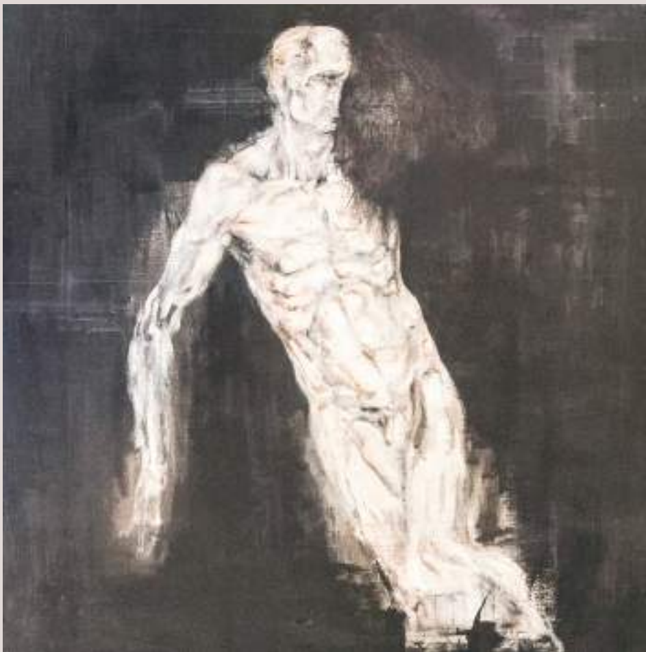
Ànima (Acrílic i llapis de color sobre paper , 70x50,5cm)