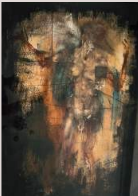
Ariel II (Acrílic i llapis de color sobre paper, 78x59cm)