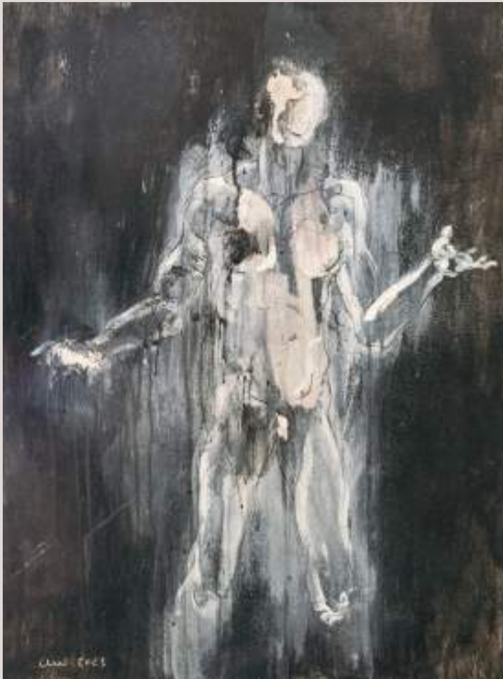
Vi (Carbonet i vi sobre llenç, 80x80cm)