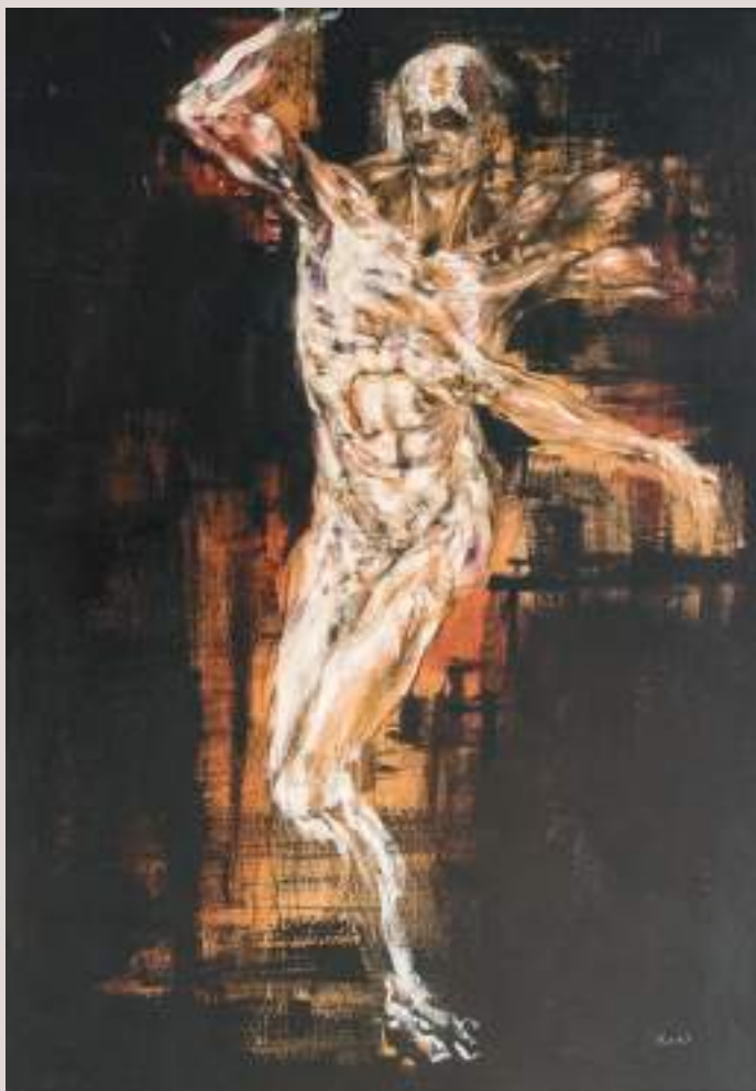
Insomne (Acrílic i llapis de color sobre taula, 129,5x68,5cm)