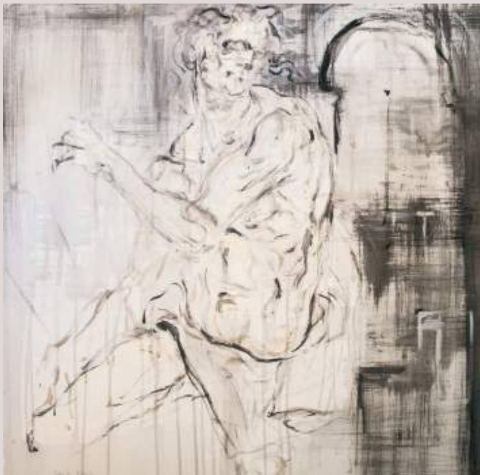
Memòria (Acrílic i bolígraf sobre llenç, 55x46cm)