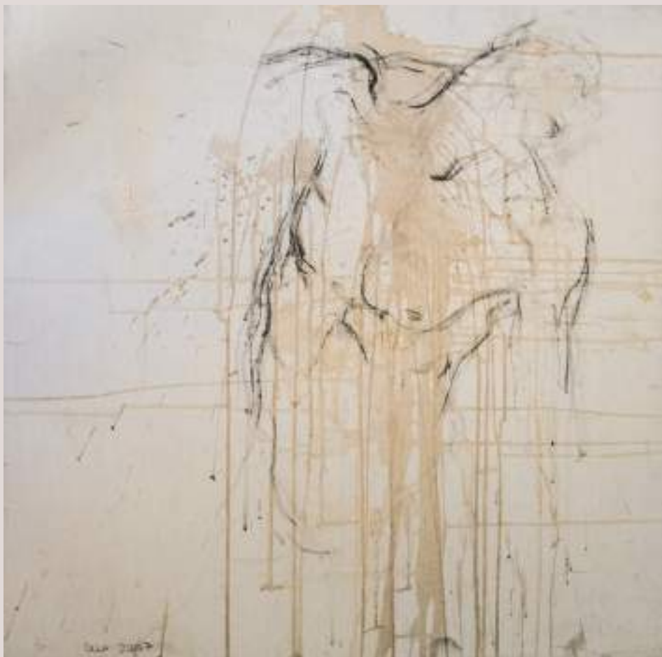
La nit oscura de l'ànima (Acrílic i llapis de color sobre cartó, 77x53cm)