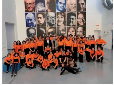
Exposició “Antoni Miró, a La Base”

“Investigador de qualsevol tècnica de la qual es puga valer en el seu ofici d’artista... Adora l’obra única i no deixa de promoure l’obra múltiple amb el mateix amor i dedicació” Wences Rambla.