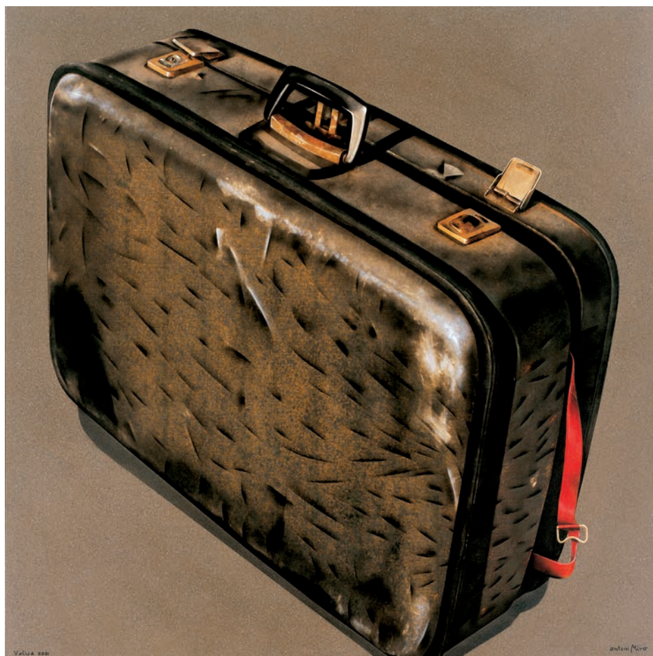
VALISA 2001/ Madrid (Acrílic i metall s/ llenç i traçador, 116x116) Antoni Miró.

Tota sola la valisa amb la tanca del roig que penja. Solitud o nostàlgia? El temps, potser, que mai no s'hi detura i consum les coses i les hores. Aquesta imatge és una mena de referència al viatge que significa restar ben a dins dels fragments de vida que ens corresponen de solcar. El món, a la valisa: poca cosa i molta disposició per a fer el camí d'Odisseu enardit pel compromís no gens circumstancial.