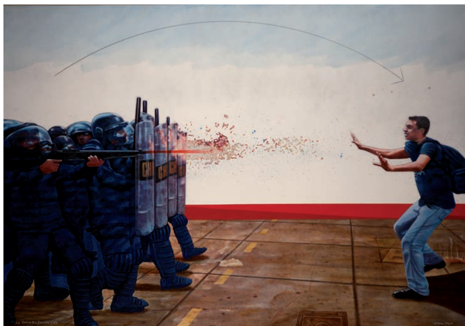
LA POLI A RIO JANEIRO 2014/ Brasil (Acrílic s/ llenç, 114x162) Antoni Miró.

Aquesta manera de veure, i de fer, de l'artista, com també passà amb els avant-guardistes alemanys i russos, la suavitat i potser la fredor en l'ofertament de les seues propostes icòniques signifiquen sinònims d'autenticitat i d'objectivitat, tot partint d'una tècnica de precisió en el trasllat referencial de les imatges.