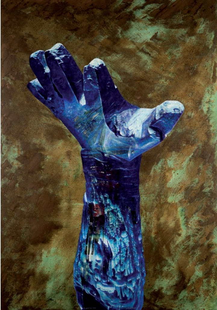
ESQUERRA 2010/ Barcelona (Acrílic i metall s/ llenç, 162x114) Antoni Miró.

Una pintura, aquesta, que té l'entrellat significatiu més enllà dels símbols. L'esquerra és una posició «geogràfica» que s'hi vincla per l'oposició de la dreta. Açò fent valer l'anonimat de les idees mai no preterides. I l'evident recorregut del coneixement assolit des de la distància dels dies, incorpora tot de matisos capitals a l'hora de fer-ne el just trasllat al moment present.