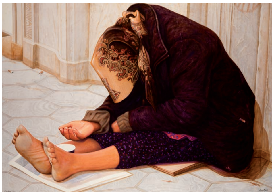
MENDICAR 2010/ Barcelona (Acrílic s/ llenç, 114x162) Antoni Miró.

Aquesta pintura d'Antoni Miró pertany a la sèrie dels «pobres». Obra de matisos compassius que determina la visió social que l'artista du a terme tothora, fent referència a l'entorn immediat dels pobles i ciutats. El xoc de realitats que s'hi viuen al si de les societats contemporànies. Una reflexió al voltant de les desigualtats que l'actual sistema econòmic capitalista arbora. Potser també la pena (el caràcter compassiu al qual hem al·ludit), que irradia la imatge de la pidolaire asseguda a la vorera i demanant almoina per caritat.