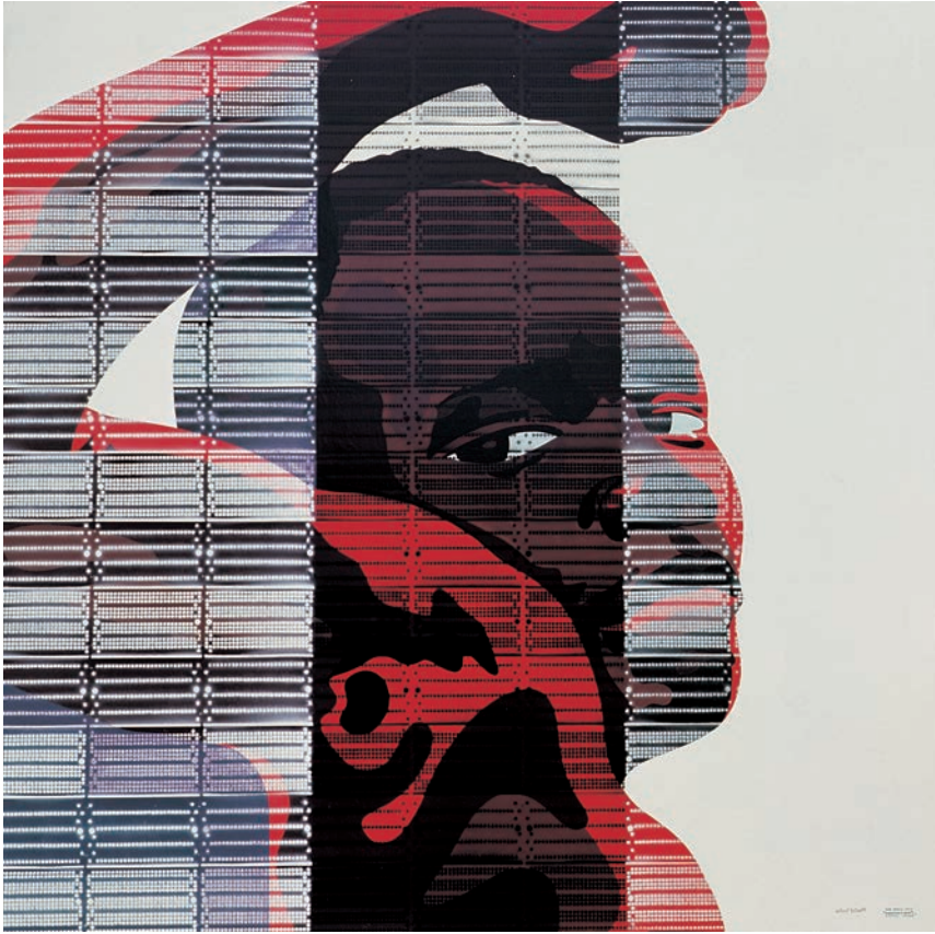
VENCEREM 1972 (Acrílic s/ taula, 100x100 i Metallgràfica , 80x80) Antoni Miró.

Amèrica Negra (1972), sèrie a la qual pertany aquest quadre, Vencerem, resta ben pròxima a la que podríem definir com «pintura social de denúncia». Però no només açò determina l'abast i vinculació dels continguts car hi ha el transsumpte estètic que s'hi afegeix al valor ètic del relat perceptiu.