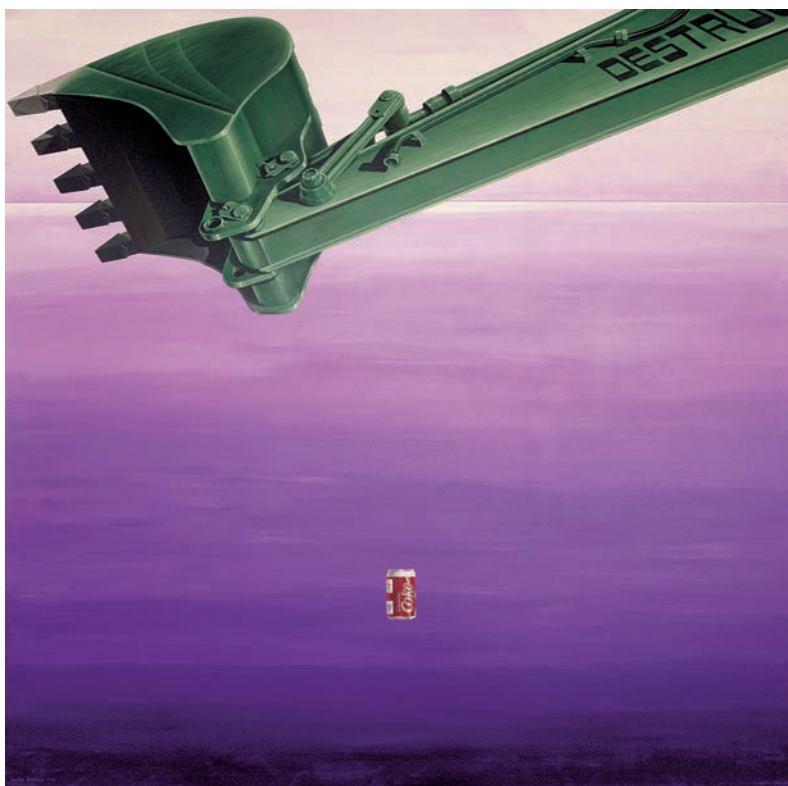
COSTA BLANCA 1993 (Acrílic s/ llenç, 200x200) Antoni Miró.

Restem al davant d'un pop avançat on se substitueixen les tints planes per un joc, intens d'ombres i de llums, que acreix l'objecte pictòric. També hi conviu una mena de surrealisme que juga amb la realitat crítica, i la versemblança de l'escena que se'ns presenta. Dues armes igualment poderoses: la pala mecànica, símbol de la destrucció del litoral mediterrani, i el pot volander de Coke, fidel recordatori de la voracitat de tots aquells hòmens de negocis que mai no deixen d'afanyar-se en la destrucció a canvi de diners.