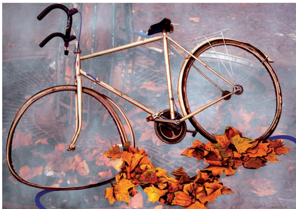
TARDOR A PARIS 2009/ Paris (Acrílic s/ llenç, 81x116) Antoni Miró.

Recolzada a l'arbre, com una deixalla somorta, resta sola la bicicleta. I s'hi percep una triple lectura en aquesta proposta pictòrica: en primer terme, a manera de veladura, un món fantasiejat que rep la vella andròmina; també la bicicleta al primer plànol de la pintura...emmudida, aïllada, amb els estris descompostos, tan atrabiliaris; i la darrera empremta resulta ser la presència de la realitat metafòrica de la tardor, amb catifa de fulles esgrogueïdes, i deguda a la inclemència de l'estació autumnal.