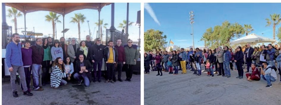
Concert i Presentació de Pintura Musicada a la Marina de València 2018.

“Món Ferit”. En subsèries com “Bicicletes”, “Personatges” “Pobres”, “Museus”, “Viatges” “Mani-Festa” “Costeres i Ponts” “Suite Eròtica” “Tribunal de les Aigües” “Suite Habana” “Nus i Nues” entre altres.