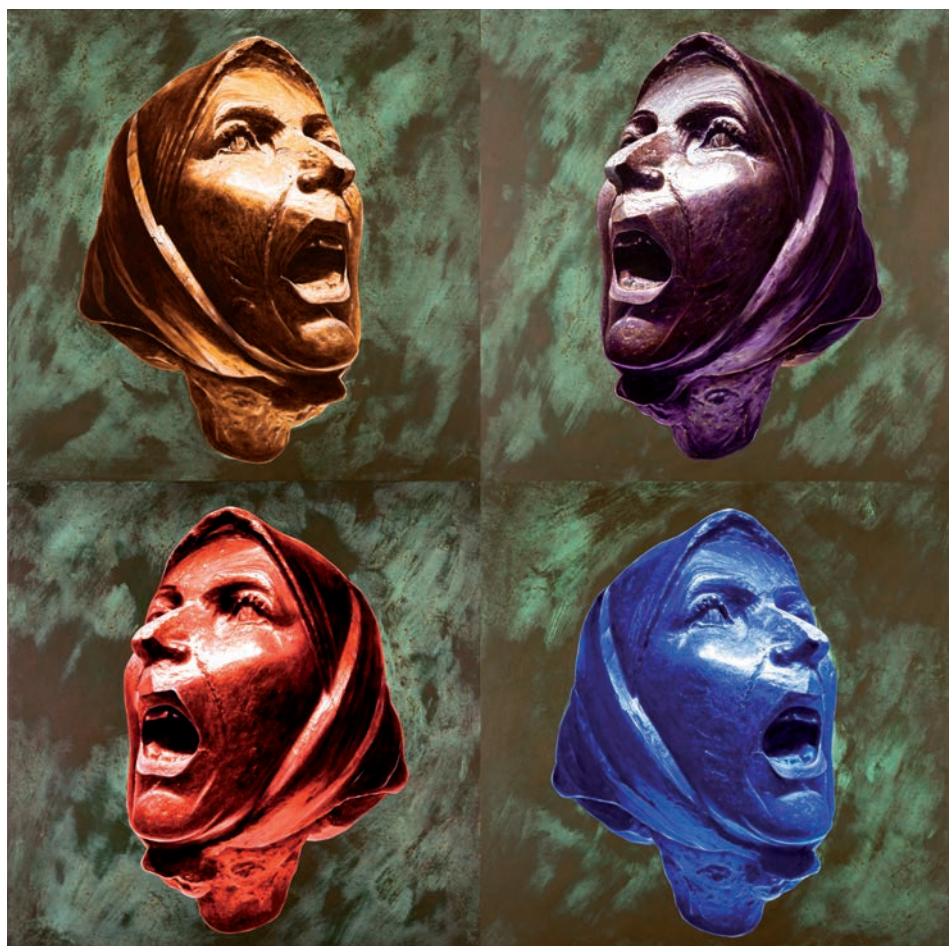
QUATRE CRITS 2011 (Acrílic i metall s/ llenç, Políptic 232x232) Antoni Miró.

L'obra sintetitza la generosa mirada que l'artista disposa davant la realitat del dolor. I no es tracta d'un sofriment metafísic, per contra s'hi avé amb la força comprensiva de l'humanisme cultural. Quatre figures i una sola voluntat: ferir els timpans del vent amb la força devastadora de la protesta, i, potser, de la raó també.