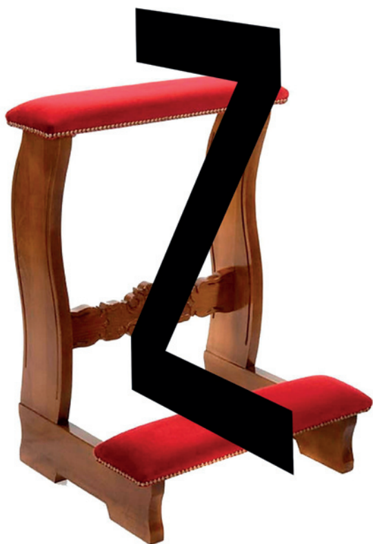
“Zeta de rezar”