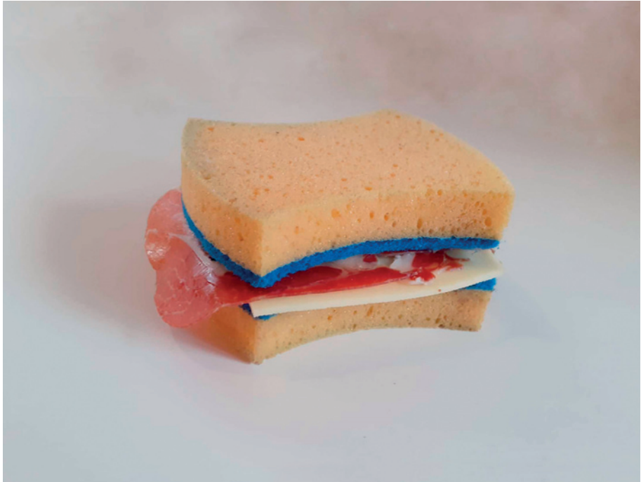
Sàndwix molt esponjós